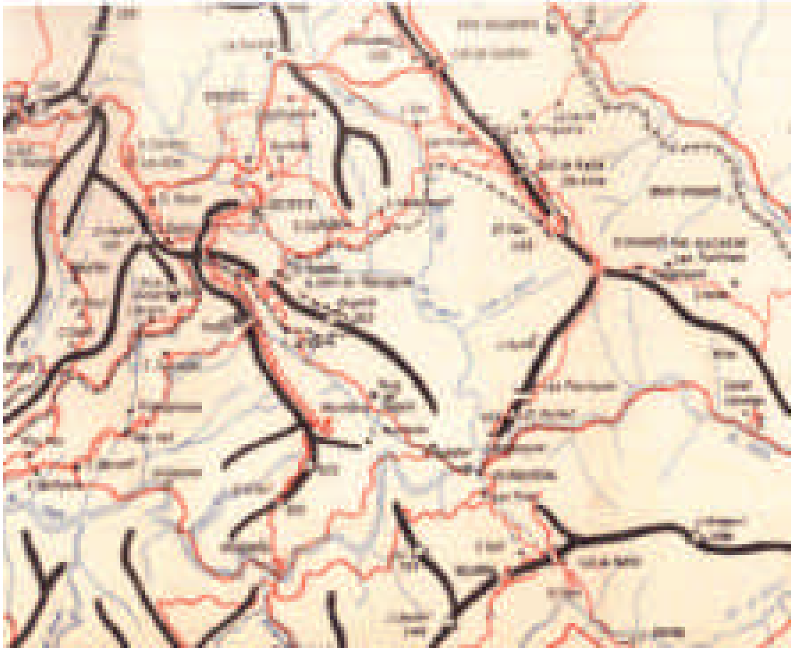
Pàgina anterior, a dalt: El plano de les Guillerias de Juli Serra (1890) a escala 1:20.000