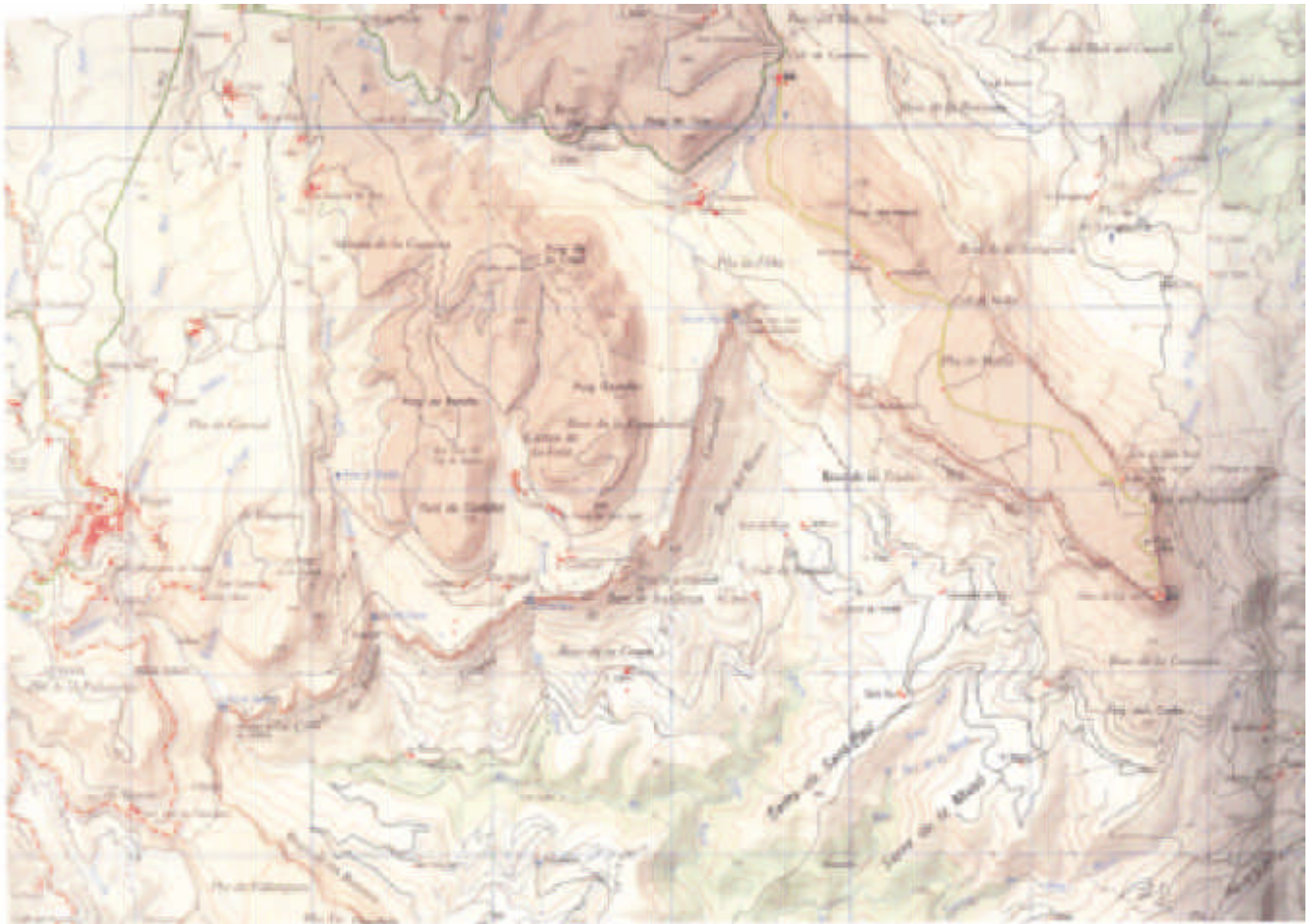
El Collsacabra, mapa coordinat per Anna Borbonet i Ernest Gutiérrez (2001) a escala 1:25.000

1:100.000 i la seva extensió és molt similar al mapa del CEC de 1924. Aquest mapa és a tres colors, sense corbes de nivell, però mostra les principals carenes amb un traç negre gruixut.