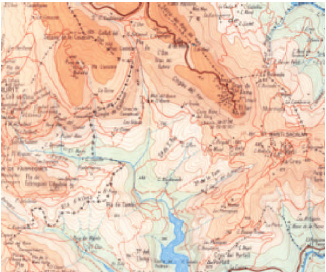
Zona del Far del mapa Les Guillerias-Collsacabra, de l'editorial Alpina (anys 60) a escala 1:40.000