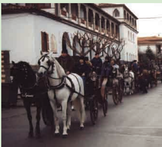
La Festa dels Tonis

El 14 de gener es va celebrar un any més la tradicional Festa dels Tonis organitzada per l'Associació Cultural per la Festa de Sant Antoni Abat de l'Esquirol. La jornada va començar amb un esmorzar pels participants a l'Hostal Collsacabra. A mig matí es van beneir els animals davant l'església i es va passar pels carrers del poble amb la música la Banda Infantil de Vic. A la tarda hi va haver un espectacle eqüestre a càrrec de Santi Sercamshows i per acabar el grup Arrels de Roda de Ter va oferir l'obra de teatre "Deixa'm el teu llit. On? Quan? Com?" a la pista de la Cooperativa.