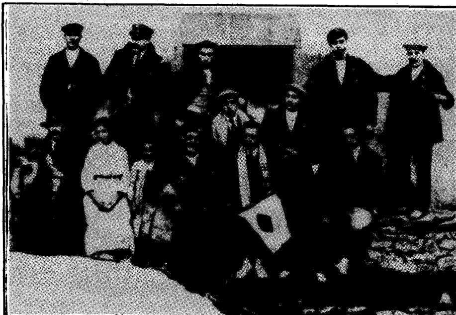
Uns dels primers estiuejants junt amb gent del poble dels anys deu als vint.

Darrerament, s'han obert una nova botiga de queviures i un restaurant, adequats per a atendre els visitants dels nostres dies. Igualment ha pogut tornar a tenir vida un paleta contractista, per haver-se construït algunes cases noves i renovellat altres de velles.