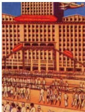
Catifes mòbils i funiculars