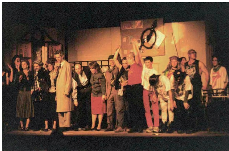
Sempre la ballarem

Els "Tai-a-treros" de l'Esquirol és un grup de teatre amateur que neix l'any 1993 de les ganes de fer teatre d'un grup de joves del poble, amb la voluntat d'aprendre l'art de l'escena i sobretot divertir-se, tot refermant amistats i inquietuds.