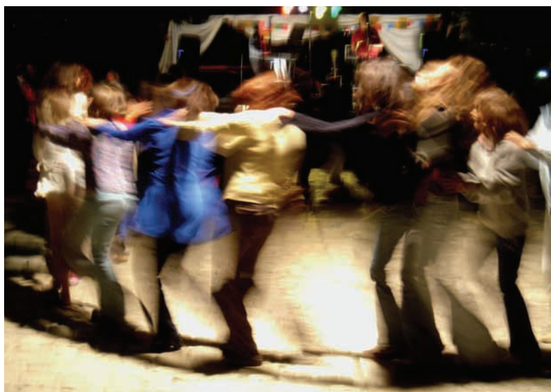
Una manipulació de l'autenticitat produeix efectes plàstics.

aquestes imatges poden ser difoses per qualsevol canal dels sistemes actuals que són, com a mínim, el telèfon, l'Internet o la televisió.