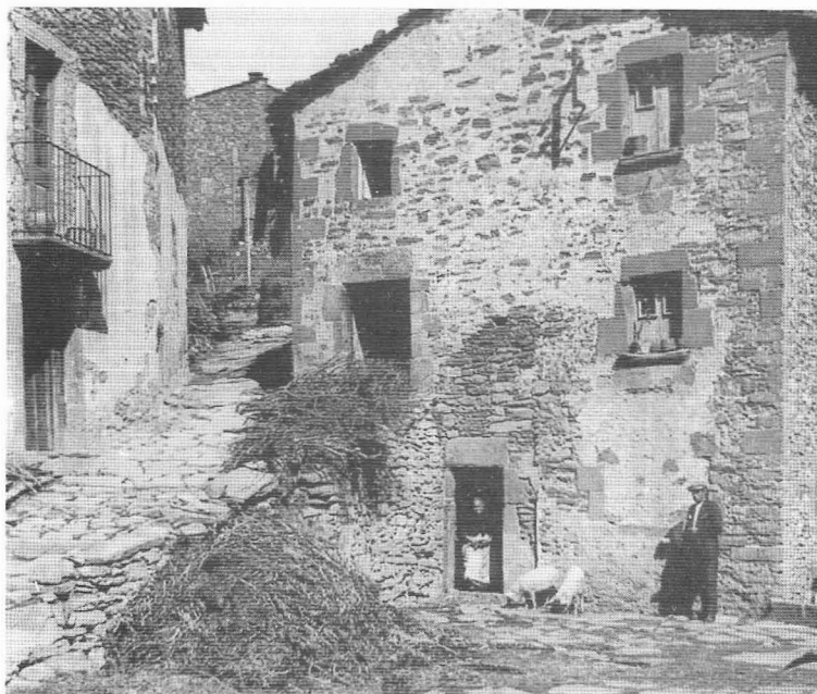
Rupit. Casa de Dolors Galobardes

Segurament que fou descobert lo haverse escapat de presoner. No he pogut saber de fixo lo dia 12 . Se li han fet varios sufragis.