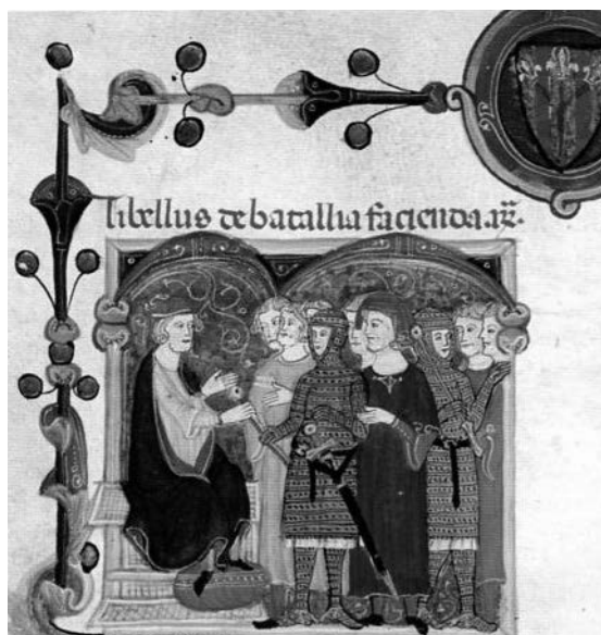
Íncipit del Llibre de batallia facienda , sobre el duel judicial, segle XIV.

Mas dirà a sa senyoria [el rei Alfons] com retornant mossèn Jofre de Rocabertí, germà del vescomte de Rocabertí, de la cort de la dita senyora [la reina Maria], prop de Sent Celoni, li són eixits en un mal pas onze ballesters e mataren-lo. La dita senyora escriví tantost al governador que de continent anàs allà e inquirís qui ho havia fet, car la fama era que la vescomtessa [Blanca de Cruilles] ab altres parents del vescomte de Rocabertí lo havien fet matar perquè consentí en un matrimoni que es féu del fill del vescomte ab la filla del vescomte d'Èvol. Partí de Barcelona e fons a Gerona e donà mal recapte en la cosa. Ha trobat com en Sitjar ha publicat com ell l'ha mort cuidant