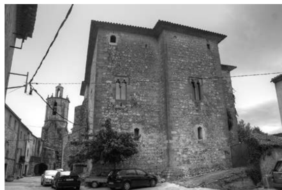
Castell de Sant Mori.

Aquesta cessió de l'herència mostra que els Rocabertí eren una família cohesionada i ben