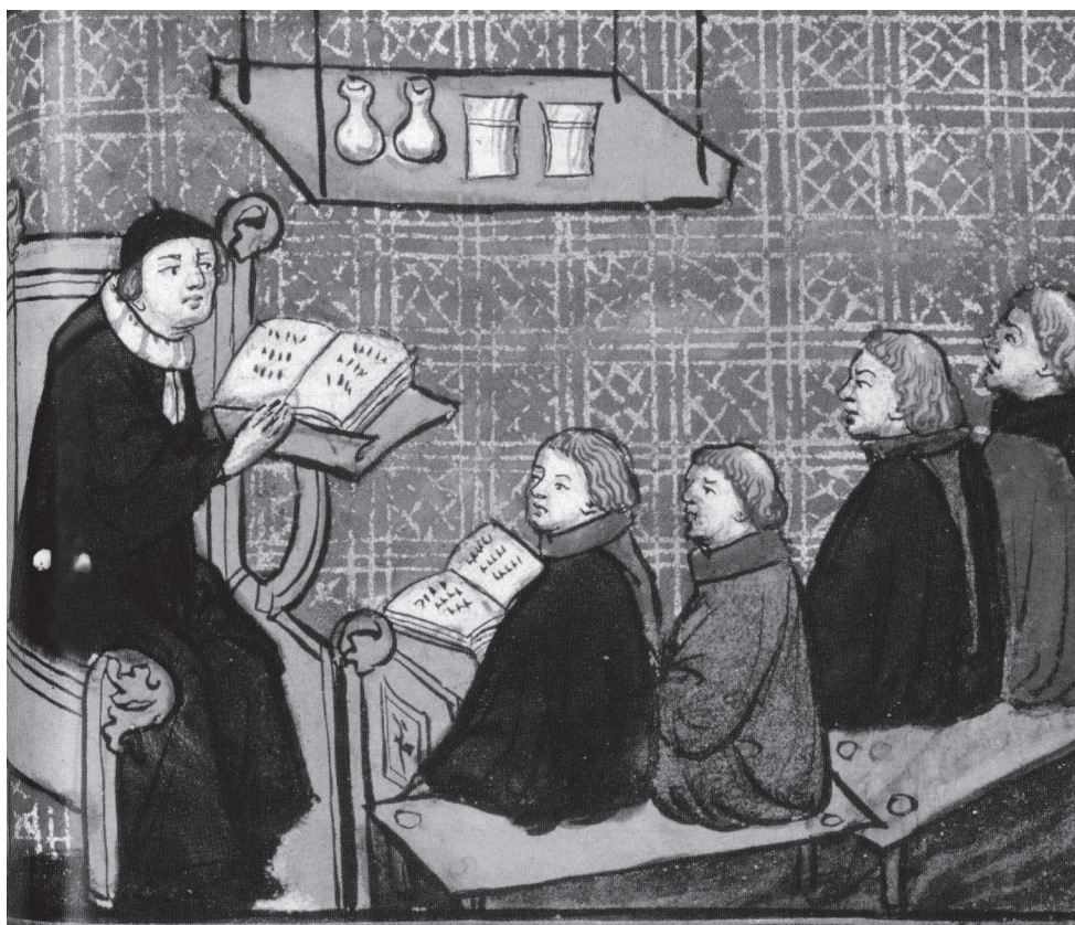
Classe de gramàtica en una escola de principis del segle xv (miniatura d'un manuscrit del Livre des propriétés des choses del franciscà Bartomeu l'Anglès, British Library, Ms. Royal 17 E. III, f. 36).

Aquestes queixes responien a una realitat que, per raons diferents, no satisfia Pere Damiani, Alexandre III, Dante, Vicent Ferrer o Eiximenis. La carrera de dret –i, dins del dret, en primer lloc el civil i en segon el canònic– oferia unes perspectives econòmiques i de promoció personal extraordinàries als estudiants. Sens dubte, la possibilitat d'incorporar-se –i fer-hi carrera!– a l'administració civil dels estats o a l'eclesiàstica, fins i tot abans d'acabar els estudis, era molt sovint un esquer massa seductor com per fer desaparèixer qualsevol desig d'estudiar teologia. El moment era, indiscutiblement, propici: tant els estats, que estaven consolidant la seva estructura jurídica i administrativa, com la pròpia Església, que sempre n'havia necessitat, de juristes, però que aleshores en tenia més necessitat que mai per defensar, per exemple, els seus drets