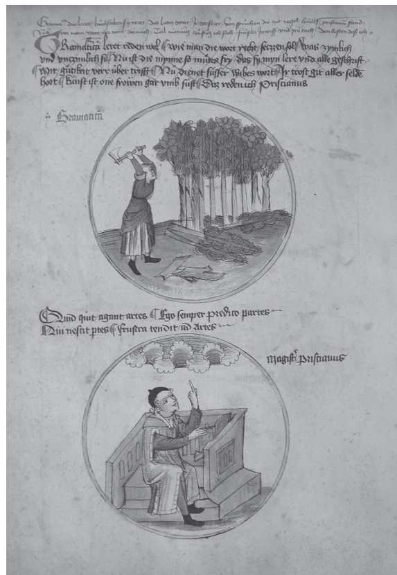
Miniatures al·legòriques de la Gramàtica (Unibibliotek de Salzburg, M III, f. 36).

Robert d'Anjou, tot i ser un home savi en moltes disciplines, va triar de parlar de la forma més humil possible perquè ningú no es pensés que era un savi presumptuós, només preocupat per les vanes curiositats o per fer ostentació dels seus coneixements estèrils. Hi ha una frase, gairebé un aforisme, d'Agustí d'Hipona que Eiximenis solia citar per atacar les desviacions de la ciència mal orientada: Melior est fidelis ignorantia quam temeraria scientia . De Robert d'Anjou —i de molts savis franciscans o influïts pel franciscanisme com ell— Eiximenis podia haver dit que era millor la ciència fidel i humil que la ignorància temerària, perquè la ciència que, per una banda, es perdia en curiositats excessives i s'oblidava de Déu i, per l'altra, la ciència que només era un mitjà per la promoció de qui la posseïa no eren res més, per Eiximenis, que manifestacions de la ignorància més temerària. La veritable saviesa, per sant Bernat de Claravall i per Eiximenis, era la que es destinava a edificar els altres o a edificar-se a un mateix.