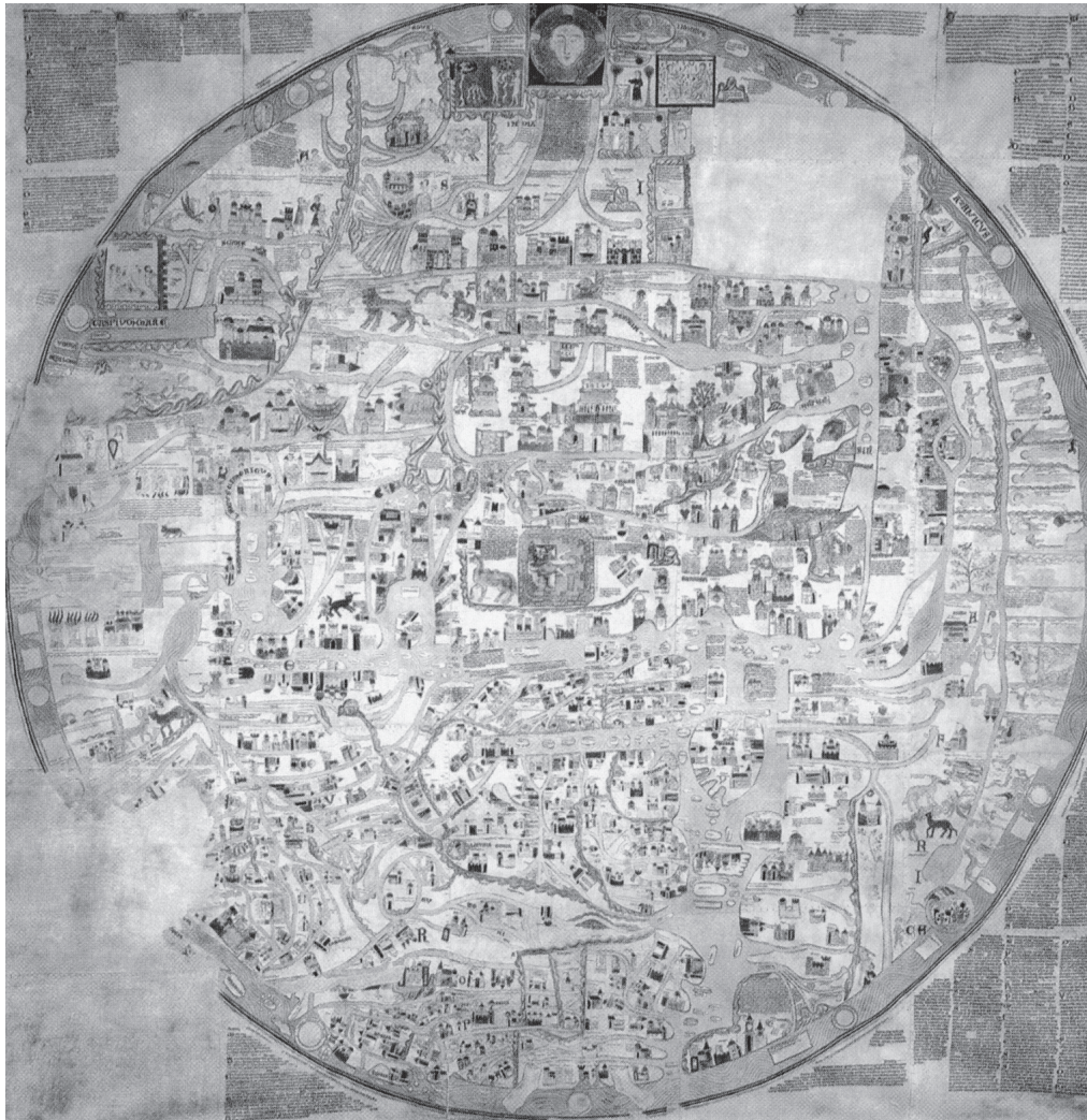
Mapamundi del monestir d'Ebstorf, atribuït a Gervasi de Tilbury el 1234, de 3'5 m de diàmetre.