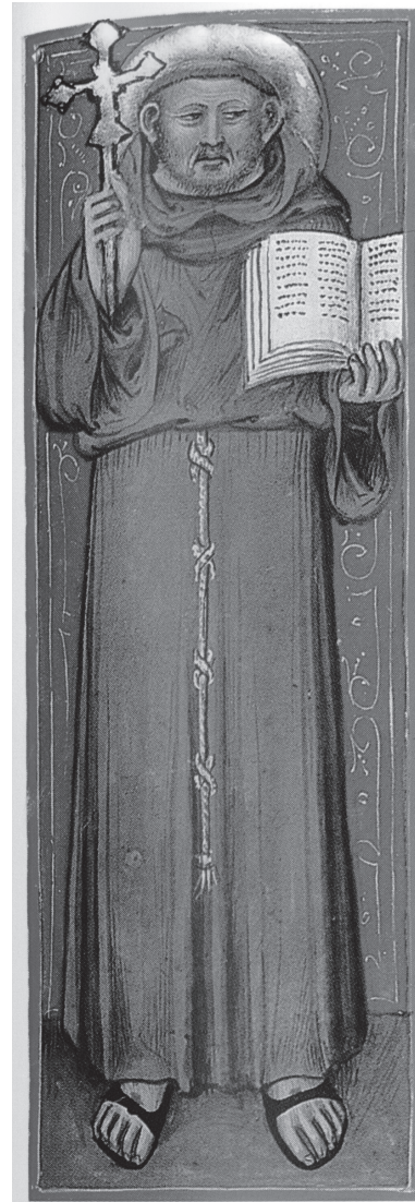
Francesc d'Assís predicant amb una creu i una Bíblia a les mans.

Per questo l'Evangelio e i dottor magni son derelitti, e solo ai Decretali si studia, sí che pare a' lor vivagni. A questo intende il Papa e' cardinali: non vanno i lor pensieri a Nazarette, là dove Gabriello aperse l'ali. (Paradiso IX, 133-38)