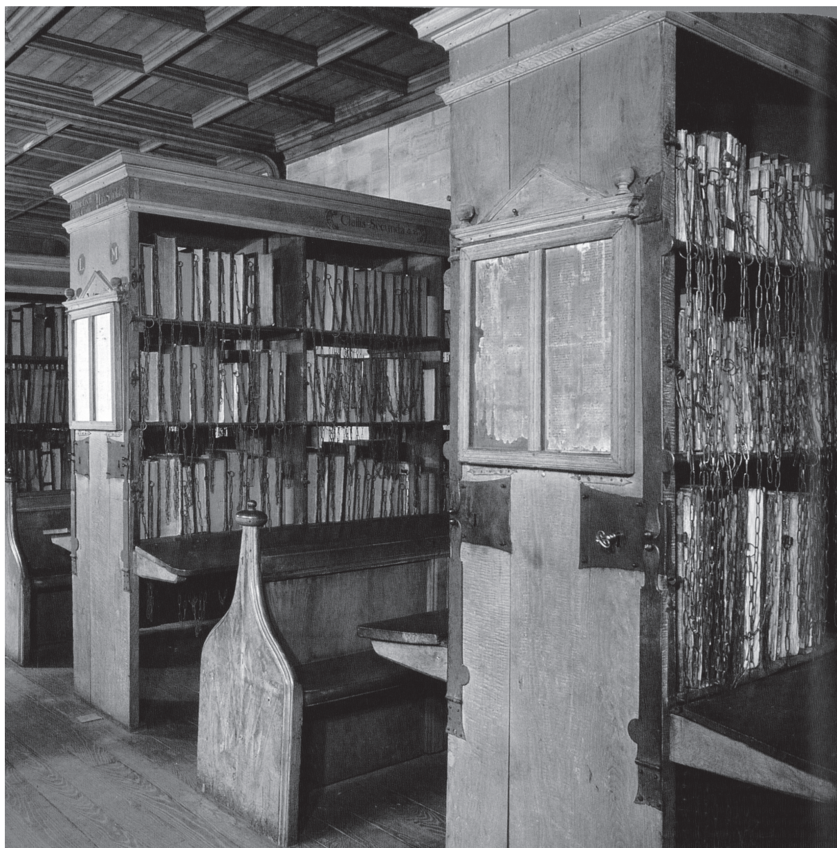
Libreria medieval de la catedral de Hereford (Anglaterra).

d'una brillant carrera acadèmica en universitats estrangeres, tornaven a casa i buscaven de seguida un càrrec a l'ombra dels poderosos. Les queixes eiximenianes, expressades sobretot en el Terç del Crestià , contra els intel·lectuals que, oblidant-se de Déu, es vantaven de l'agudesa del seu enteniment, de la seva bona memòria, de la seva ciència o de la bellesa dels seus llibres i dels seus escriptors són una crítica prou evident contra aquesta mena d'intel·lectual superb i fals. Vicent Ferrer explicava de vegades en els seus sermons una mena d'exemple que en for-