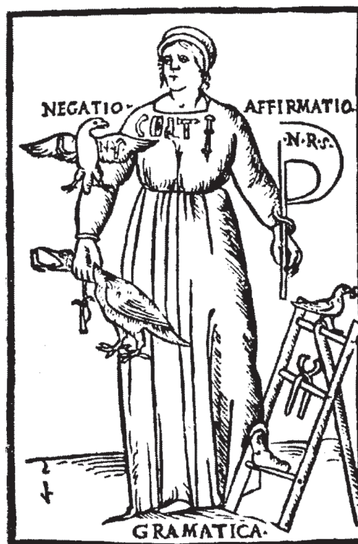
Al·legoria de la Gramàtica, gravat del Congestorium artificiosae memoriae (Venècia 1533) del dominic Johannes Romberch.