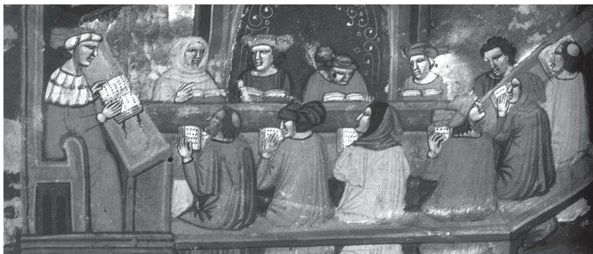
Un mestre i els seus alumnes al segle XIV (Lió, Bibliothèque Municipale, ms. 374, f. 1r).