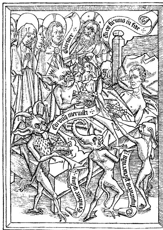
Gravat de l' Arte de bien morir (Saragossa, c. 1450).

Joan Pasqual no tradueix simplement les «ficcions» i «moralitats» de Bersuire, sinó que les reescriu combinant notícies diverses del De fabulis poetarum , del Commentarium de Pietro Alighieri i, en algun cas, de l' Elementarium de Papius (s. XI). Habitualment acumula al començament de cada capítol tots els elements descriptius o narratius de la ficció corresponent, i a continuació ofereix la interpretació de cada un d'aquests elements, sovint en claus diverses (moral, teològica, política). També tendeix a establir una significació fixa per a cada fauna (Caront, Plutó i Cèrber són el diable; Prosèrpina és l'ànima pecadora o damnada; les donzelles de Prosèrpina són pecats o penes que acompanyen l'ànima pecadora o damnada, etc.) i aplica de manera recurrent uns pocs mecanismes (el