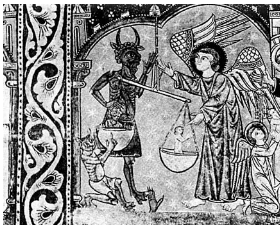
La psicòstasi, o pes de les ànimes, representava el moment en què es decidia la condemna o salvació de l'ànima. El dimoni sempre intenta endur-se alguna ànima de més (MNAC, Barcelona).

Però foren els autors neotestamentaris que transformaren aquesta segona mort dels malvats (Ap 21,8) en una pena eterna a l'infern. L'evangelista Mateu, que recorda les portes de l'infern (16,18), descriu amb detall el judici final i amenaça els malvats amb un càstig etern (25,31-46). Mateu i Lluc coincideixen a anunciar «plors i cruixit de dents» per als exclosos del regne del cel, condemnats a les «tenebres exteriors» (Mt 8,11-12; Lc 13,23-29), allò que els teòlegs escolàstics anomenaran «pena de dany» ( poena damni ). Antecedents de la «pena de sentit» ( poena sensus ) són «la gehenna del foc» (Mt 5,22), «la gehenna, on el corc no para ni el foc no s'apaga» (Mc 9,47-48) i «la llacuna de foc encesa amb sofre» (Ap 19,20; 14,10-11). Sant Lluc ofereix encara un altre episodi cabdal: la paràbola del pobre Llätzer i el ric epuló (16,19-31), en la qual es distingeixen clarament un lloc de tortures, on el ric és turmentat pel foc, i un altre de repòs per a Llätzer, el «si d'Abraham», on els teòlegs situaran el limbus patrum , el lloc on residiren els justos de l'Antic Testament fins a la redempció de Jesucrist (Minois 1991: 72-78).