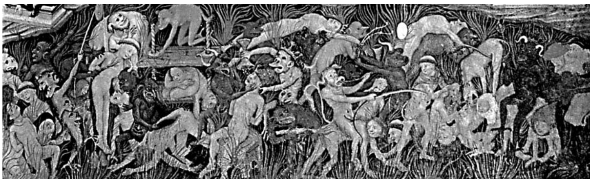
Rafael Destorrens, Missal de santa Eulàlia (1403): detall dels condemnats al Judici Final (Arxiu de la Catedral, Barcelona).

Malauradament, el Tractat de les penes particulars d'infern s'interromp amb el títol del capítol LI «Del frau comès per obra», que hauria pogut contenir els baraters, els lladres i, finalment, els traïdors. Però ens queda el consol de poder llegir els capítols del Commentarium de Pietro Alighieri en què sens dubte s'hauria inspirat, i restituir així la integritat d'una obra molt significativa per a la història de la cultura catalana en la tardor de l'Edat Mitjana.