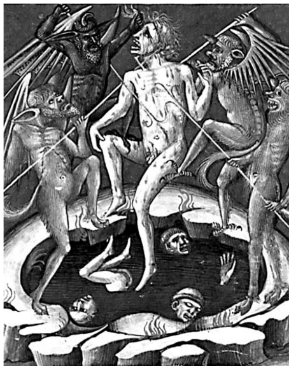
Turment de Ciampolo de Navarra a la Commedia , potser obra de Bartolomeo di Fruosino, cap a 1420 (Biblioteca Nacional, París).

L'exemple més evident d'aquest canvi de plans és l'anunci d'una obra especial sobre el purgatori, fet al final de la Summa de pena («Del receptacle de les ànimes purgables serà summa distinta d'aquestes, mijançant la gràcia de Déu») i en el breu capítol dedicat al purgatori en el Tractat de les penes particulars d'infern («D'aquest lloc no havem al present tractar, car en tractat singular que serà fet de purgatori llargament, la gràcia de Déu mijançant, investigarem»). Aquesta obra no era prevista el 1436 en el pròleg de la Summa de beatitud ni tampoc en el curs de la Summa de pena (f. 63va):