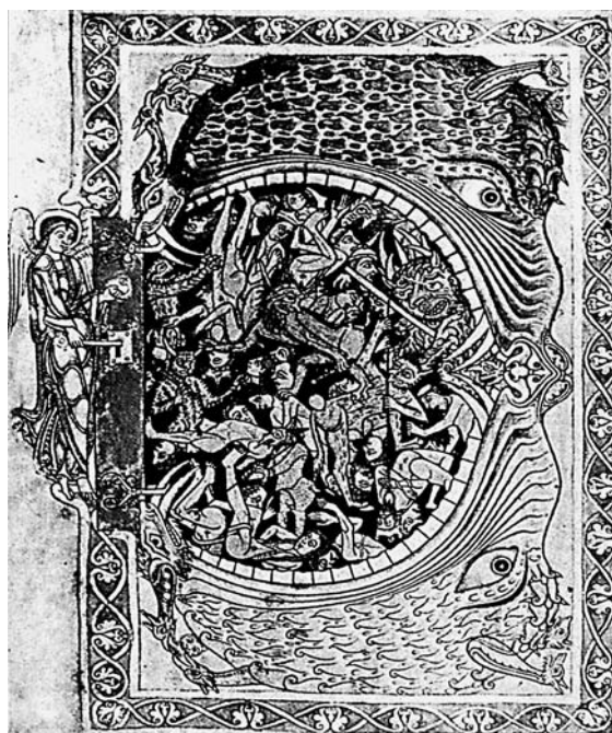
A la boca de l'infern d'aquest manuscrit anglès, els damnats de tots els estaments socials són empesos cap a les profunditats (British Library, Londres).

Aquesta taxació, tan escarida d'imatges, representa el grau màxim de sofisticació a què arribaren els teòlegs. Però l'infern i les seves penes van exercir una fascinació tan poderosa en la imaginació del poble cristià que des de ben aviat va gosar desbordar els estrets marges de l'Escriptura i la teologia per a nodrir una abundant literatura infernal (Ciccarese 1987, Morgan 1990): llibres apòcrifs com la Visio Pauli o l' Evangelium Nicodemi (s. III); la multitud d'anècdotes i visions infernals narrades per sant Gregori el Gran en els seus Diàlegs (c. 593) i per Beda en la Historia ecclesiastica gentis Anglorum (s. VIII); la visió de Sunniulf, referida en la Historia