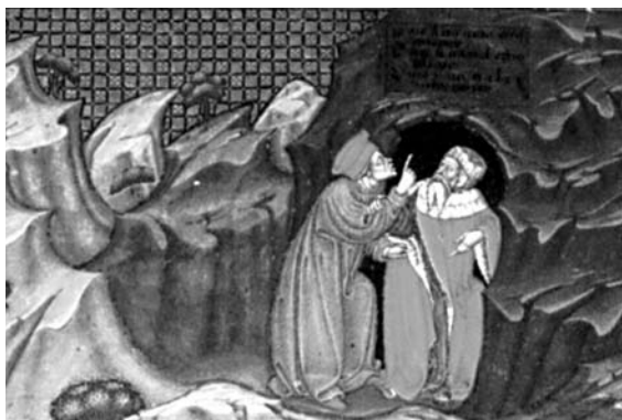
Dante i Virgili al cercle dels fraudulents. Miniatura d'escola llombarda (c. 1440), atribuïda al Mestre de les Vitae Imperatorum (Imola, Bib. Comunale, cod. 32, f. 21v).

fern no el mena Beatriu, figura de la teologia, sinó Virgili, que és figura de la raó humana». Certament, els llimbs dantescos acullen l'Antinfern i els Camps Elisis de l'infern virgilià ( Aen. VI, 428-547, 628-678).