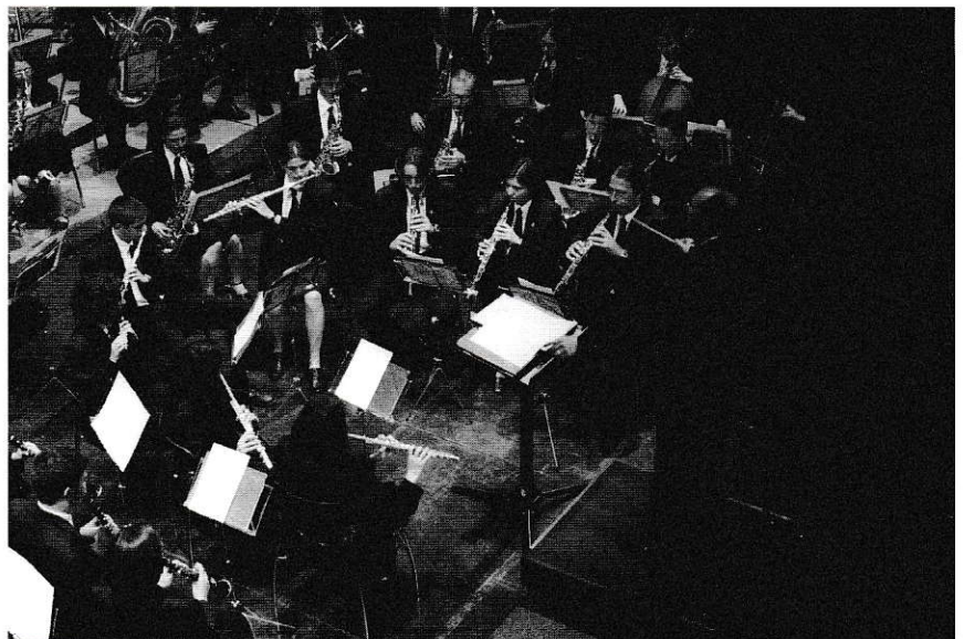
Banda Unió Musical de Tarragona

Tarragona, en concret, no s'escapa d'aquestes realitats culturals pobres fins ara esmentades i viu instal·lada en un cofoisme cultural basat en el patrimoni. Un concepte de patrimoni, però, massa limitat al que po-