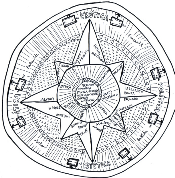
Figura 1. Máquina rosa de los vientos . Autor: Carla Boserman

prospección requiere de una nueva incorporación, de un nuevo atravesamiento para lo material: la erótica. Ahí la primera hipótesis-desplazamiento.