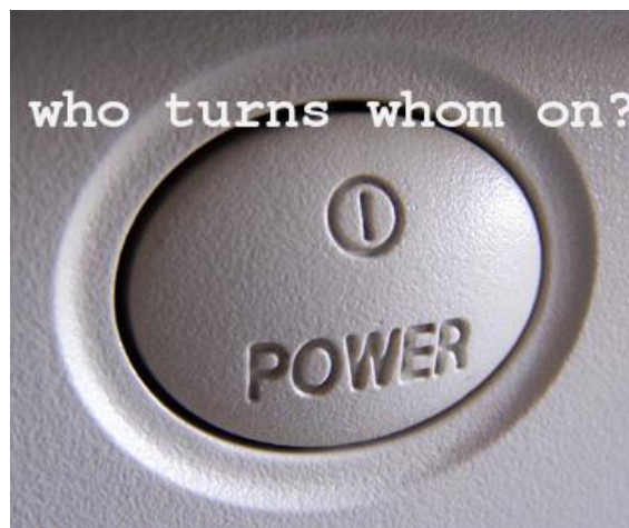
Figura 3. The Power Button . Autor: Jara Rocha

El eje difractante de la política señala dos lugares: un rayo hacia la cuestión de la relacionalidad. Formas para la gobernanza compartida entre humanos y humanos, entre humanos y no-humanos, entre no-humanos y no-humanos. Otro rayo, apuntando a la cuestión de la frecuencia: ¿qué temporalidades, qué ritmos políticos exige el territorio extensísimo de la materia? Cuando el colectivo belga Constant preparaba la 14ª edición de su bienal Verbindingen/Jonctions , tenían claro que su habitual mirada transfeminista en esta ocasión querían dirigirla hacia las relaciones de convivencialidad con los servidores informáticos. Muy elocuentemente, llamaron al evento “Are You Being Served?”. Directo, interpelante. Querían atender a las condiciones de propiedad, dependencia, manipulabilidad y cuidado de unas infraestructuras muy cercanas y cotidianas, pero con las que sin embargo a menudo no compartimos situaciones de intimidad: “The initial outset [...] was to not take server-client relationships for granted” (Constant, 2015).