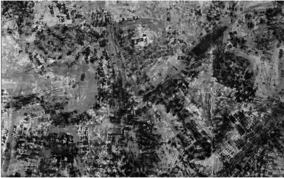
Arman Grand Cachet, 1958 Empremtes de tampons, guaix i tinta sobre paper (150 × 240 cm) Museu d'Art Modern de Ceret (MAMC)