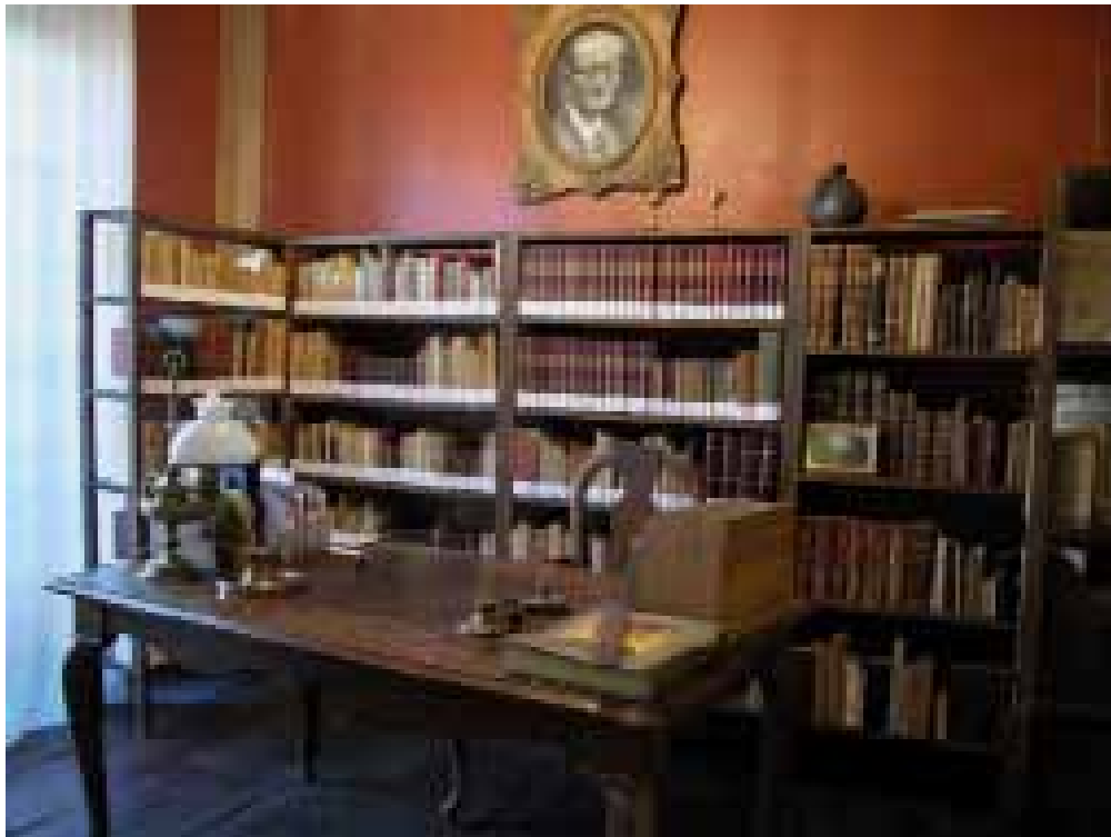
Biblioteca de Vicente Risco. Fundación Vicente Risco