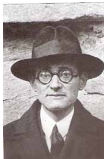
Retrat de Vicente Risco

Conèixer Maragall sovint implica investigar uns laberíntics lligams amb els artistes i escriptors del seu entorn amb qui va tenir relació o concomitàncies il·lustratives. A voltes cal seguir camins on quasi s'ha esvaït la petja, tot i ser substancials per lligar una biografia molt complexa. Sovint cal viatjar lluny, i desplaçar-se per visitar les cases-museu d'alguns dels seus coetanis amb qui va compartir inquietuds i afanys. Aquest és el cas que avui proposem. Vicente Risco, una mica més jove que Maragall, comparteix amb ell afinitats i coincidències rellevants: ambdós escriptors són persones benestants, amb els avantatges i també amb els condicionaments que suposa viure de renda. Pel que sabem, tots dos eren d'aspecte menut i delicat amb un toc de dandisme. Compartien finor d'intel·lecte i disposició mística mundana. Ambdós mantingueren una actitud discreta enfront dels moviments socials i polítics de la seva època tot i haver-ne estat ideòlegs rellevants sobre les arrels dels nacionalismes. Les conclusions, però, a les quals arribaren, en llurs estudis sobre l'esdevenir de la nació gallega i la catalana dins un marc de l'iberisme, semblen divergir. Tot i que pouaren de les mateixes deus i es mogueren en àmbits selectes similars, el ruralisme de l'un i el cosmopolitisme urbà de l'altre els donaren perspectives oposades a l'hora d'encarar el futur.