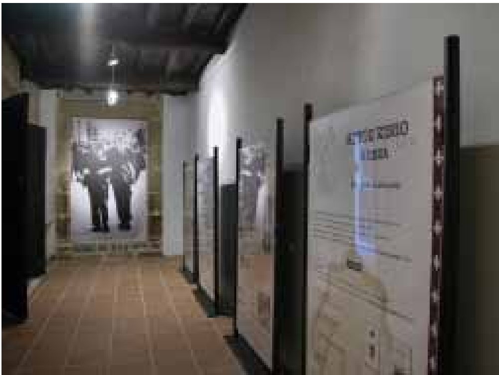
Entrada de la Fundación Vicente Risco