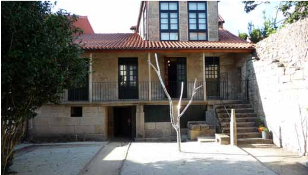
Fundación Vicente Risco