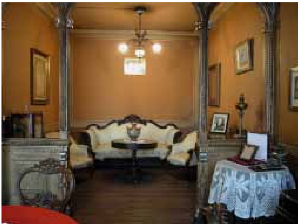
Dormitori de Vicente Risco.