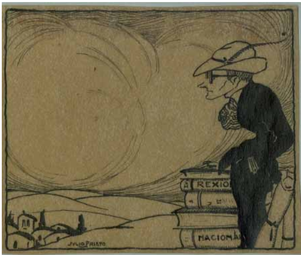
Caricatura de Vicente Risco, per Prieto Nespereira.