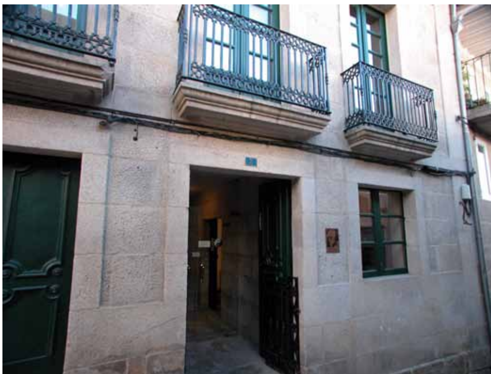
Façana de la Fundación Vicente Risco