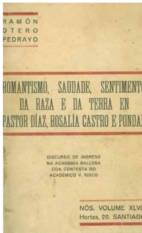
Portada del núm. 48 de la revista Nós (1931)

L'any 1920 aplega les seves reflexions polítiques en el llibre Teoria de nacionalismo galego , publicat en gallec i castellà (1930), on deixa establerta la importància que tenen el paisatge i les tradicions ancestrals com a forces modeladores en els homes que hi viuen. Aquesta influència silent però poderosa afaïçonarà en especial un grup d'homes selectes, de refinada intuïció, proveint-los d'un acendrat sentit patriòtic; ells seran els elegits, «sintieron a voz da terra, que non queria morer», els destinats a conduir els altres.