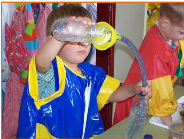
Figura 3. Racó de l'aigua.