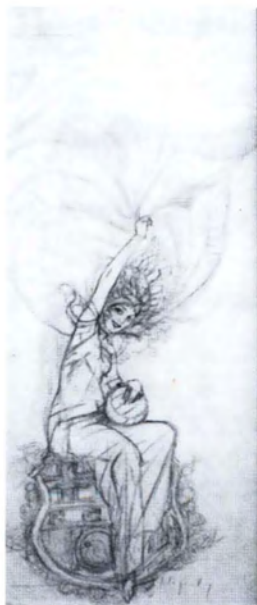
Cartel inauguración Campo de Les Corts (1923).

F. C. BARCELONA INAUGURACIO DEL NOU CAMP DE JOC GRANS PARTITS Dies 20 i 21 de Maig SAINT MIRREN - F. C. BARCELONA Dia 25 de Maig SAINT MIRREN - NOTTS COUNTY