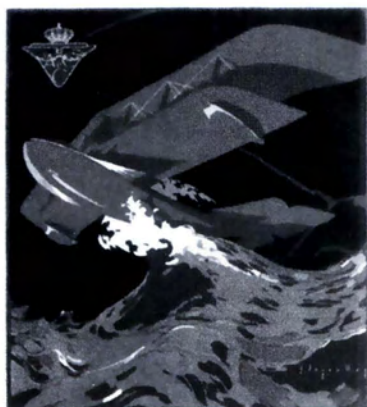
REAL AERO CLUB DE CATALUÑA. PRUEBA DE HIDROAVIONES BARCELONA-PALMA DE MALLORCA- VALENCIA-BARCELONA. 23-30 MAYO 1920

Cartel Real Aero Club de Cataluña (1920).