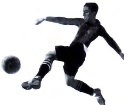
Óleo sobre madera, Paulino Alcántara.

A propósito hemos dejado para el final comentar unos aspectos de la obra de Josep Segrelles que nos interesan muy especialmente. Nos referimos al Cartelismo y al