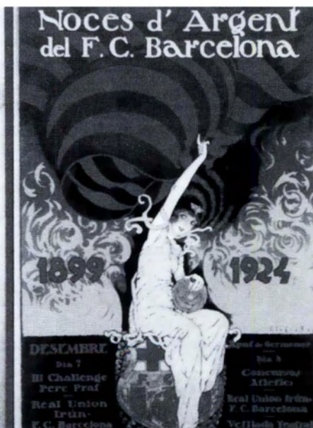
Dibujo preparatorio y cartel Bodas de Plata (1924).