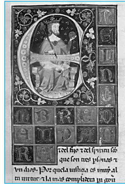
Alfonso X "El Sabio".

A través, por ejemplo, de la simbología organicista de la sociedad, el cuerpo se constituyó como el más frecuente recurso medieval para la aprehensión de las relaciones de poder y, con ellas, de la construcción y administración de la excelencia. Pero no sólo eso; mediante la sublimación o la denigración de las distintas partes corporales, pero también mediante la calificación y descalificación de formas, gestos o actitudes que eran propios de unas u otras categorías sociales, el cuerpo se configuró, más propiamente, como un operador escenográfico a través del que era posible establecer la diferencia entre lo excelente y lo deficiente, entre lo noble y lo plebeyo. 1 En una sociedad resueltamente figurativa, escenográfica y aparential, 2 el cuerpo –que no podía dejar de ser la primera y más próxima de las apariencias– proporcionaba algunos de los princi-