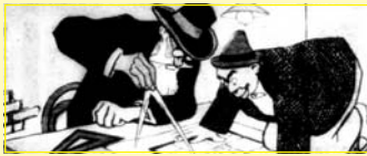
Gaudí y Opisso