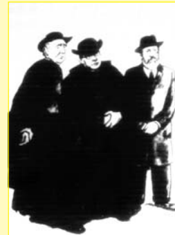
Collell (?), Torras i Bages i Gaudí

La relació Gaudí-Opisso possiblement va continuar, amb més o menys intensitat. Opisso sempre va valorar l'ensenyament artístic i humà rebut al costat de Gaudí, pel qual va sentir tota la vida una veritable veneració. Aquesta actitud es reflecteix en una sèrie d'articles publicats durant els anys cinquanta al Diario de Barcelona , a tall de memòries de joventut. Creiem que, probablement, Gaudí hauria conegut el ressò dels dibuixos esportius de Ricard Opisso i que a través d'ells potser va interessar-se, poc o molt, per l'esport.