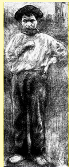
Aprenent. (Revista Luz, 1898)