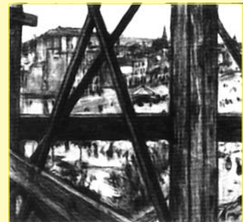
Bastides de la Sagrada Família