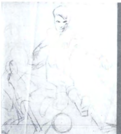
Dibuix preparatori i oli s.f., Josep Samitier.