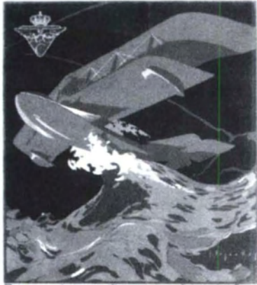
REAL AERO CLUB DE CATALUÑA. PRUEBA DE HIDROAVIONES BARCELONA-PALMA DE MALLORCA- VALENCIA-BARCELONA. 23-30 MAYO 1920