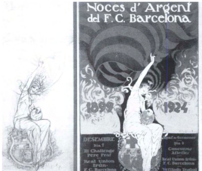
Dibuix preparatori i cartell, Noces d'Argent (1924).