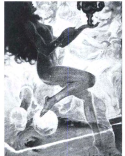
Dibuix color, Llibre d'Or del Futbol Català (1928).