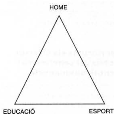
Quadre 1. La trilogia bàsica en el pensament de J.M. Cagigal.

les divisions, les unions i les divergències entre ambdues realitats.