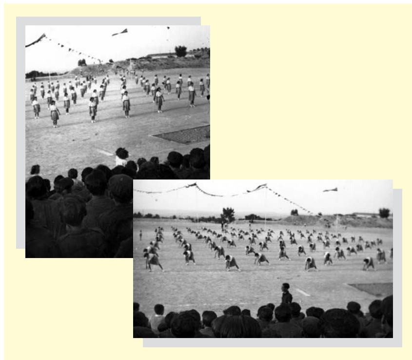
Exhibició gimnàstica organitzada per la S.F. de Jaén en el camp de futbol de "La Victoria" (1944).

troba avalada per la legislació de l'època (Zagalaz, ML., 1996, pàg. 75ss), així, a l'hora d'elaborar els plans d'estudi per a la formació de les professores, segons L. Suárez (1993, pàg. 155): "no es va plantejar cap dubte sobre si la formació esmentada havia d'incloure o no l'esport" , de manera que no és possible estudiar l'EFF sense conèixer l'organisme del qual va dependre durant trenta-vuit anys.