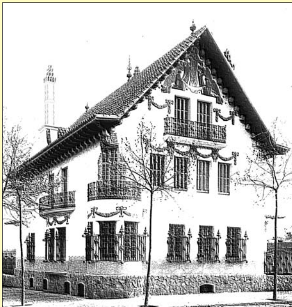
La Casa Company. Aspecte primitiu (1911)