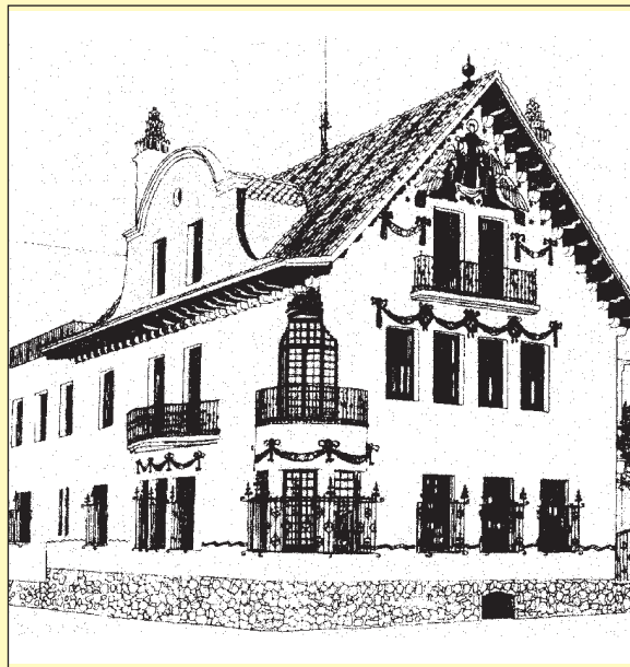
La Casa Company. Estat actual després d'unes ampliacions

En el moment de redactar aquest estudi, la formació novella de Puig i Cadafalch en arquitectura, física, matemàtiques i belles arts fa d'ell un científic en potència, amb una motivació per la recerca experimental idònia per afrontar l'anàlisi del moviment humà. La fascinació que devia tenir per la gent capaç de desplaçar-se en el medi aquàtic, o per l'infortuni d'altres ofegats en l'intent, porten Puig i Cadafalch a la redacció del primer escrit que existeix sobre la física de la natació a Catalunya.