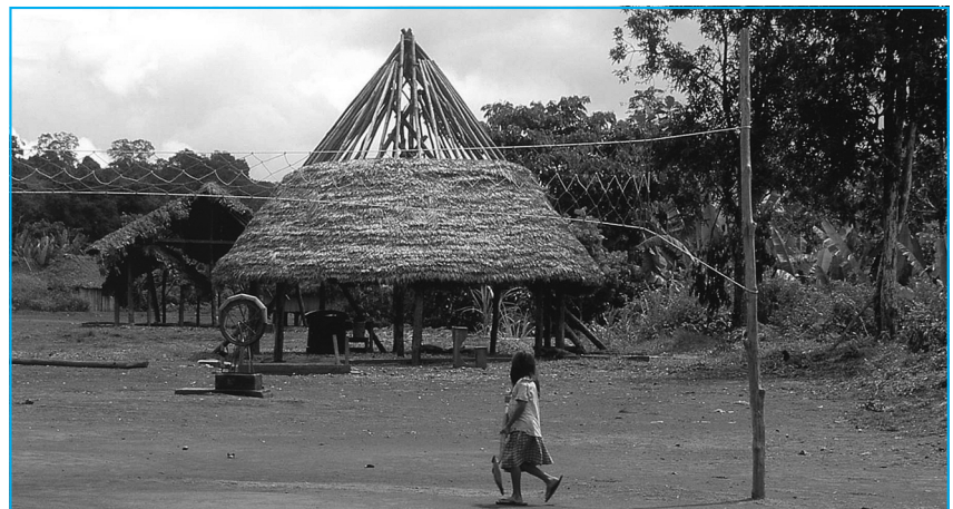
La globalització, paradoxalment, ha passat a ser una font de resignificació d'allò que és local i un estímul per a la reafirmació d'allò que hom reconeix com a propi (Font: COPELFC).

La propagació de formes de vida no condueix mecànicament a l'estandardització de les pràctiques quotidianes, ni a la "comuna-unió" en les maneres d'habitar el món. La conversió que han experimentat els productes de la globalització a cada nínxol cultural, facilitada pel sistema global de comunicació, ofereix múltiples matisos que impedeixen de parlar d'una cultura universal o d'una motricitat universal. Ben al contrari, cada cop es fa més necessari parlar de cultures, identitats, localitats, particularitats, en resum, de pluralitats. Seria arriscat, i tanmateix fóra més encertat, dir que la globalització afavoreix la concepció de la cultura com a procés, de les identitats mutants, dels territoris emergents, en breu, la multiplicació dels elements constitutius de les 'grupalitats', en els quals la motricitat compleix amb funcions específiques.