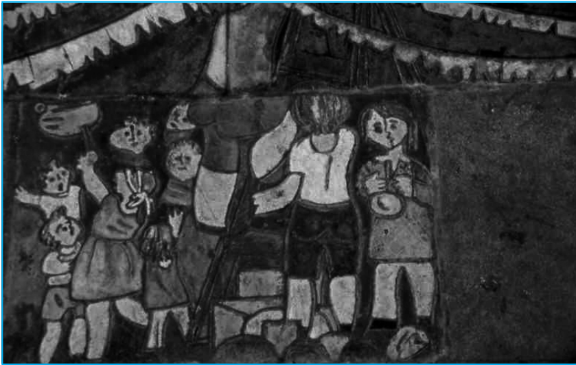
El cos és concebut com una dimensió integral que l'inscriu en els contextos i l'escriu amb els traços de la seva cultura. El cos, doncs, deixa de ser una constant biològica i psicològica, per esdevenir un constructe social que sintetitza la dialèctica naturalesa-cultura (Font: Klaus Heinemann).

dinaris, com ara cos/esperit, filogènia/ontogènia, masculí/femení, vell/jove, tècnica/expressió, racionalisme/percepció; la consolidació de models diferenciadors, tant se val que sigui des de la salut, la pedagogia, la competència, que limiten les pràctiques i generen doctrines i 'doctrinaires'. La carència de diàleg de sabers i la seva connatural negació de la pluralitat com a garantia de regeneració. L'Educació Física, com a disciplina, ha construït una identitat paràsita de les ciències bàsiques i ha confiat la seva solidesa al maneig de dades, xifres, nominacions, processos, sistemes i a les taxonomies, en la recerca d'un posicionament científic. La seva aplicació correspon a una concepció moderna positivista del món, en la qual el cos és tractat com episodis de la carn.