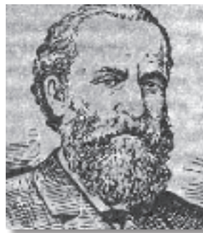
Piortr Franzevich Lesgaft