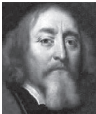
Johann Amos Comenius

El primer pedagog conegut de l'Europa de l'Est que va propugnar l'ús de l'exercici físic com a mitjà educatiu, a l'estil dels grans humanistes de la seva època, va ser Johann Amos Comenius (en txec Kommensky) (1592-1678), el qual va adoptar aquest nom per haver nascut a la localitat