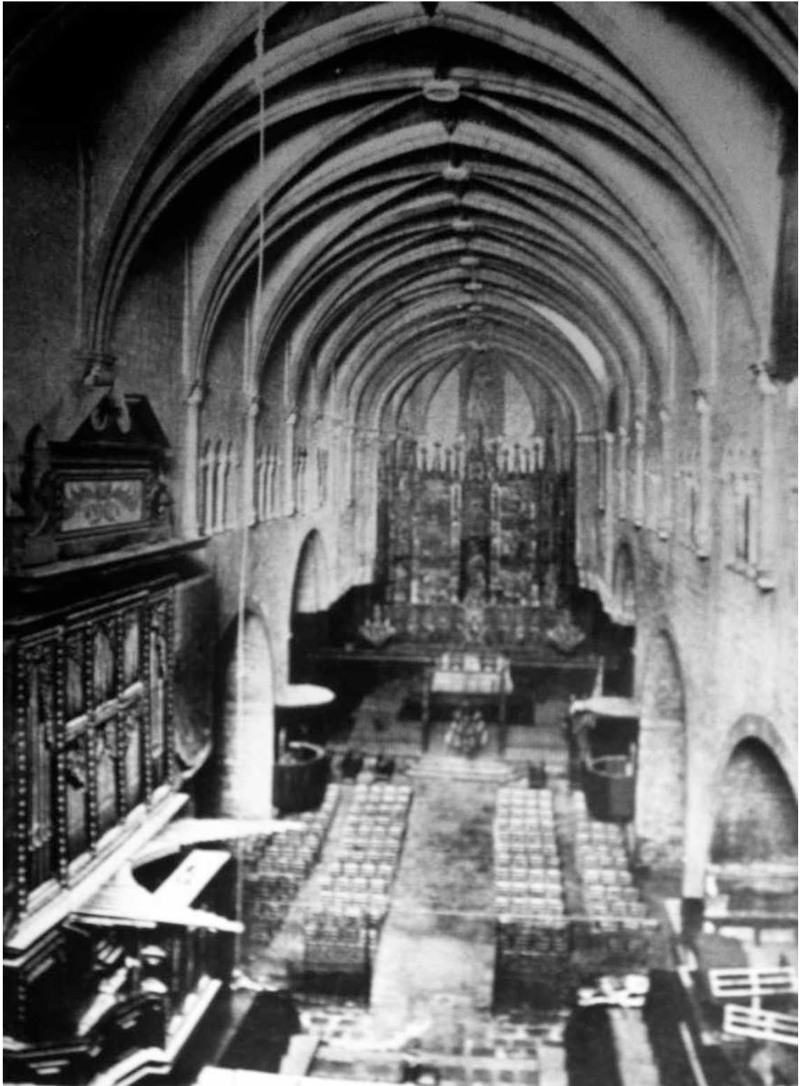
Fig. 2. Orgue de la colegiata de Sant Feliu de Girona.