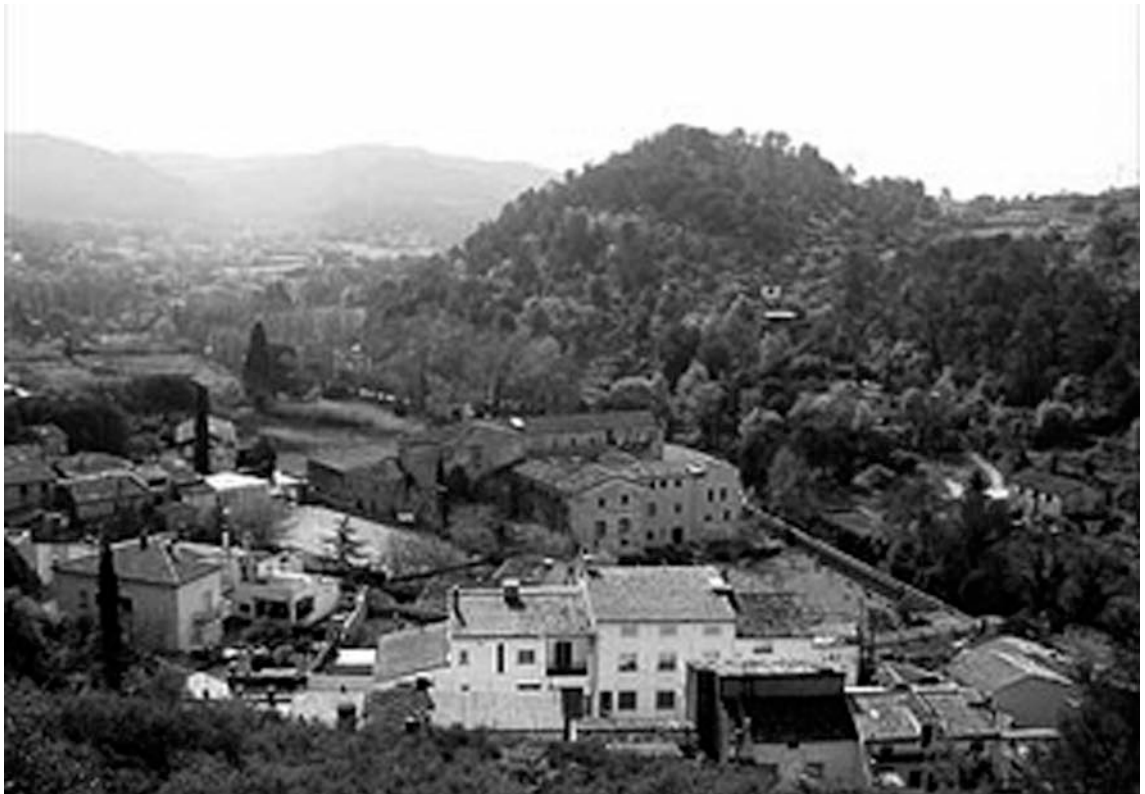
Fig. 1. El monestir de Sant Daniel a la vall ombrosa.

Les benetes, monges de la noblesa, tenen una relació privilegiada amb el bisbat, al qual tracten de tu a tu. Per aquest motiu, assisteixen en la catedral als funerals d'estat assegurades entre els canonges, però quan les releguen a les capelles laterals, primer inventen malalties de tota mena, però hi retornen per ser protagonistes de la vida ciutadana.