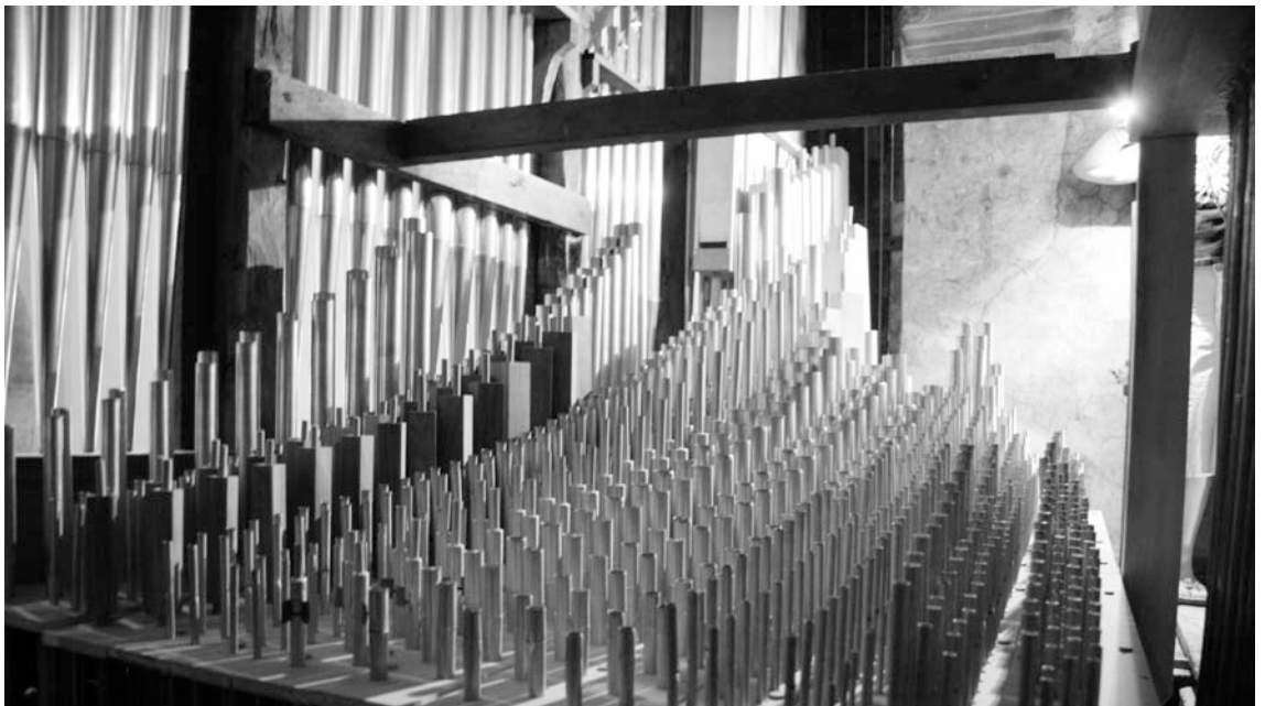
Fig. 5. Josep Boscà, orguener. La llengüeteria interior de l'orgue de Cadaqués.