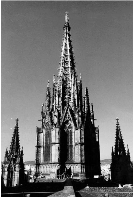
Fig. 2. Cimbori i torres de la catedral. Durant el mes de juliol de 1878 Gaudí va treballar en la base del cimbori com a ajudant del prestigiós arquitecte goticista Joan Martorell.

Naixé, així, un nou estil en arquitectura, el de Gaudí, geni amarat pels tres grans amors: els tres llibres que foren els seus mestres: la Bíblia, la natura i la sagrada litúrgia. Tanmateix, la nostra catedral