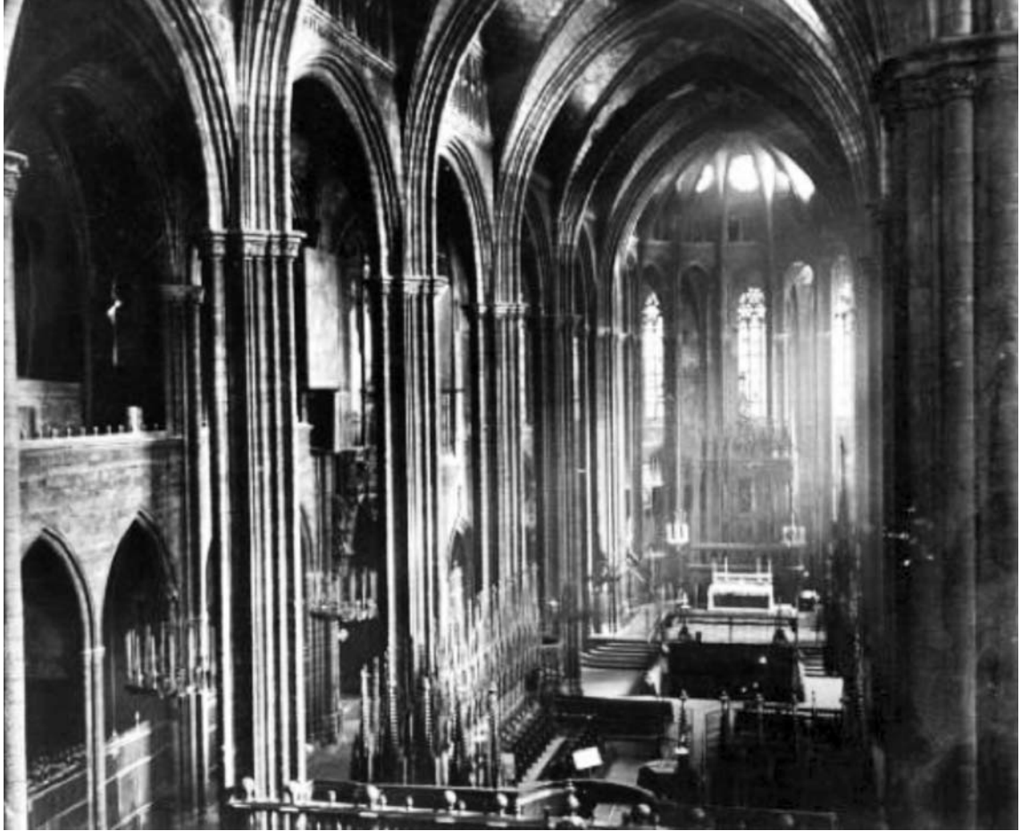
Fig. 3. Nau central de la catedral. De les catedrals gòtiques, Gaudí destacava que “l’arc del cercle de les voltes és gairebé parabòlic”. Les columnes esdevenen arbres fruiters que seran plasmats en visibles cistells en l’exterior de la basílica de la Sagrada Família.