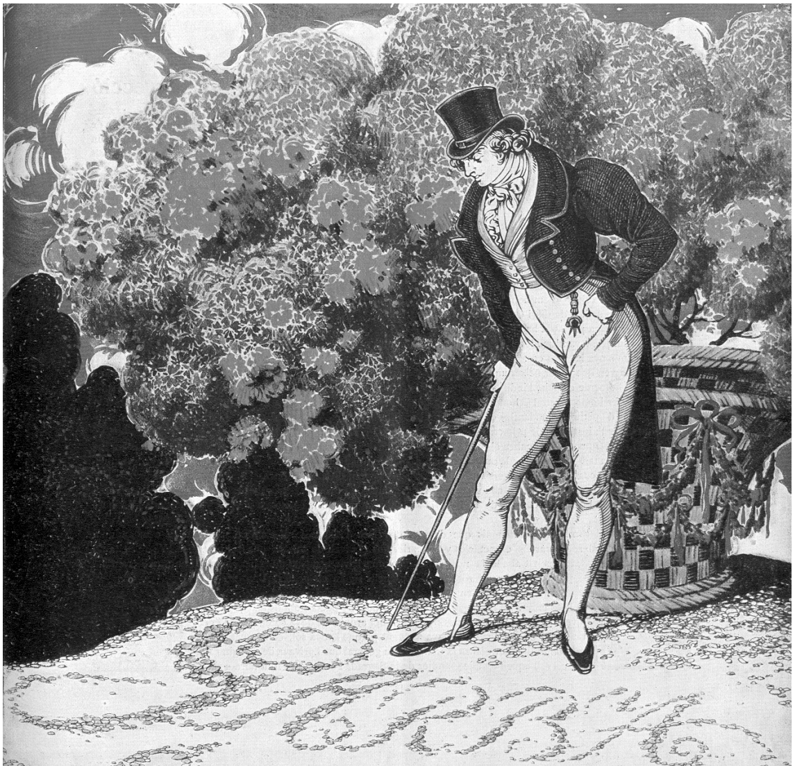
Fig. 9. Portada de Garba , 25 de novembre del 1905. En aquest estil, molt proper al de Christian Stoll, Triadó realitzà molts ex-libris.

En aquesta revista, Triadó va participar únicament a la portada per al número 2, del 25 de novembre del 1905 (fig. 9). Es tracta d'una portada en quadricromia que contrasta fortament amb les realitzades pels altres artistes. S'hi representa un senyor vestit de manera elegant, a la moda romàntica francesa, que juga amb les pedretes d'un jardí romàntic formant el nom "Garba" amb l'ajuda del bastó. La composició del nom té l'aspecte dels caràcters tipogràfics del francès G. Auriol, tot i que l'estil general del dibuix ens recorda els motius decoratius de jardins de l'alemany Christian Stoll.