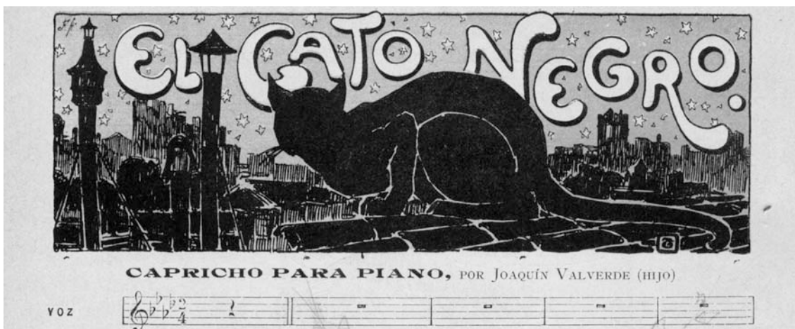
Fig. 2. Capçalera. El Gato Negro , 26 de març del 1898. El tema i l'estil recorden Steinlen.

El 1898, Carlos Ossorio Gallardo, que fins llavors dirigí Barcelona Cómica , fundà una nova revista, més pròxima a l'Art Nouveau, El Gato Negro , amb una clara influència de la revista homònima parisenca Le Chat Noir , i en qualsevol cas, un homenatge a la revista que tant va influir des de la seva aparició en el concepte de revista modernista europea d'ençà 1882. Tot i que Le Chat Noir va tenir una veritable influència en el si de les revistes il·lustrades europees, El Gato Negro català va ser un setmanari d'actualitat, de to lleuger i a vegades víctima d'una disfunció entre text i imatge. I si les il·lustracions de Steinlen i de Caran d'Ache foren les que configuraren la veritable personalitat gràfica de Le Chat Noir , les de Josep Triadó i Joaquim Diéguez donaren a El Gato Negro la seva particular visió modernista (fig. 2).