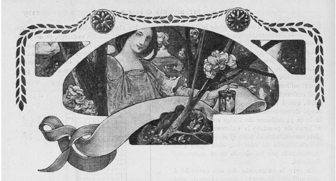
Fig. 6. Capçalera del conte “No le atiendas, linda flor”, Hojas Selectas , 1912.

rativa, formalment d'estil Art Nouveau, fou, sens dubte, una de les més modernes de l'època, tot i que no reflectia el contingut de la revista com a setmanari mensual dirigit a un públic burgès.