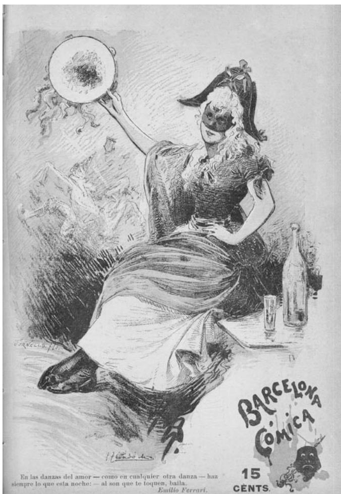
Fig. 1. Portada de Barcelona Cómica . Primera aportació de Triadó. Barcelona Cómica , 23 de febrer del 1895.

Barcelona Cómica (1889-1901) és la primera revista on treballa Josep Triadó professionalment, i recorda, sobretot a partir del 1895, en certs aspectes tipogràfics i en la col·laboració d'alguns artistes de l'època, com ara Antoni Utrillo, les revistes satíriques franceses —enaltides per la presència d'un Steinlen—, com Le Rire . Aquesta revista setmanal, de caràcter humorístic, fou dirigida en