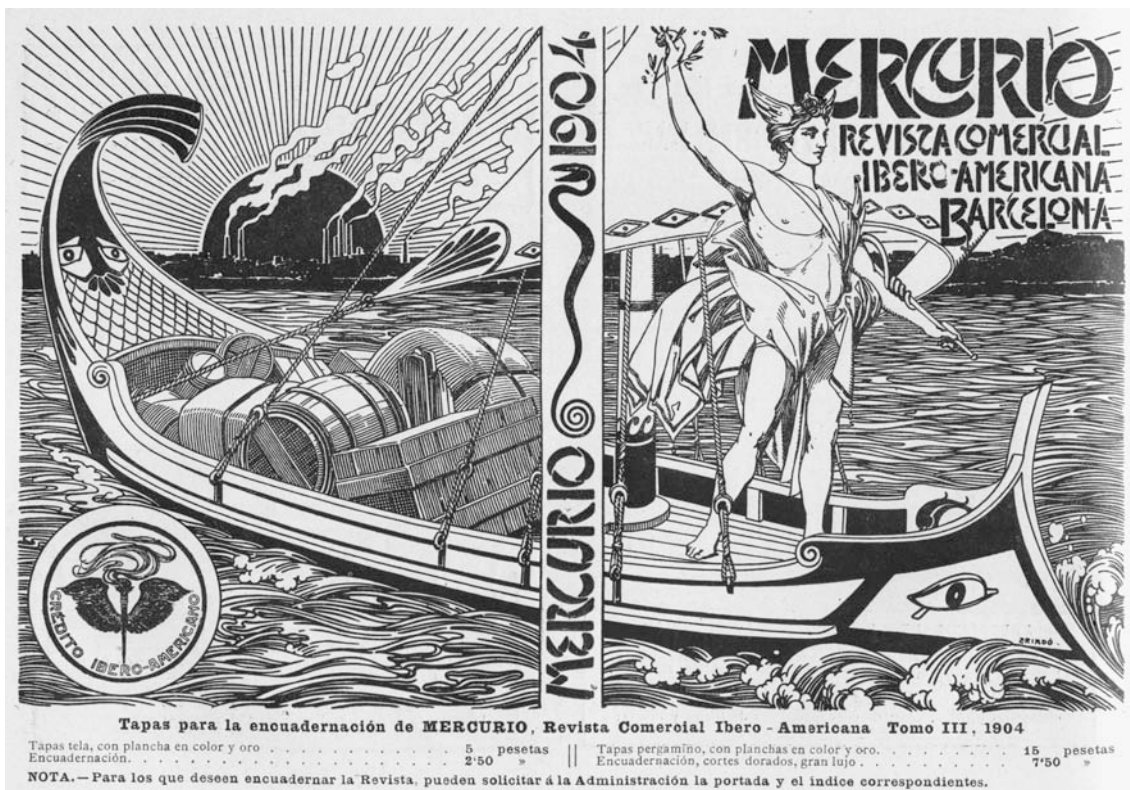
Fig. 10. Anunci de les cobertes de Mercurio , a partir del 1902. Arxiu A. Quiney.

Per a la decoració d'un conte de J. Echegaray, publicat a la revista, es va inspirar en els kakemonos japonesos de tema animal i vegetal, allargats i molt decoratius. Triadó fa una barreja entre el món terraquí i el món marí a totes dues decoracions. Per a aquesta revista, va fer altres contribucions decoratives, la més important el 1915, quan feu la portadella del número especial dedicat a la República Oriental de l'Uruguai.