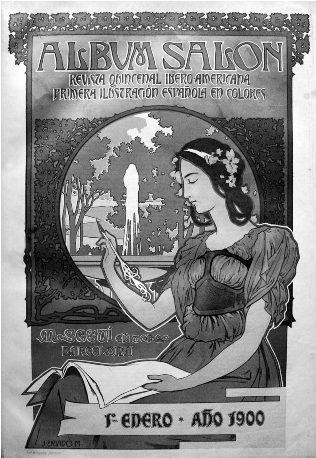
Fig. 3. Portada d' Album Salón , gener del 1900. Arxiu A. Quiney.