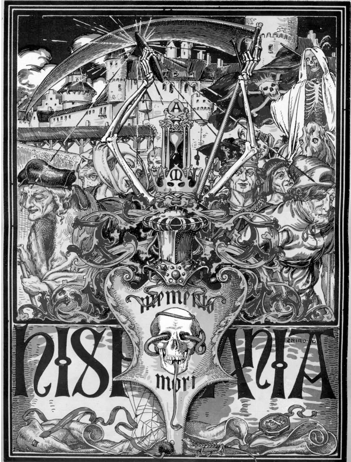
Fig. 5. Portada d' Hispania , 30 d'octubre del 1900. Triadó recorre als gravats germànics dels segles XV-XVI per a algunes composicions.

m-hi-va-l-rey-com-l-papa-com-aquell-que-no-te-cai