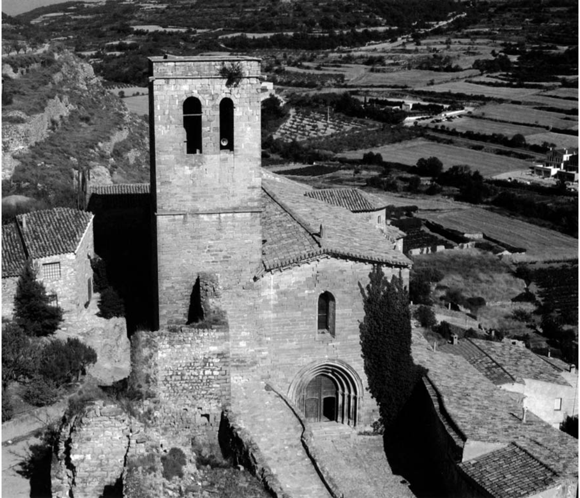
Fig. 2. L'església de Santa Maria de Guimerà.