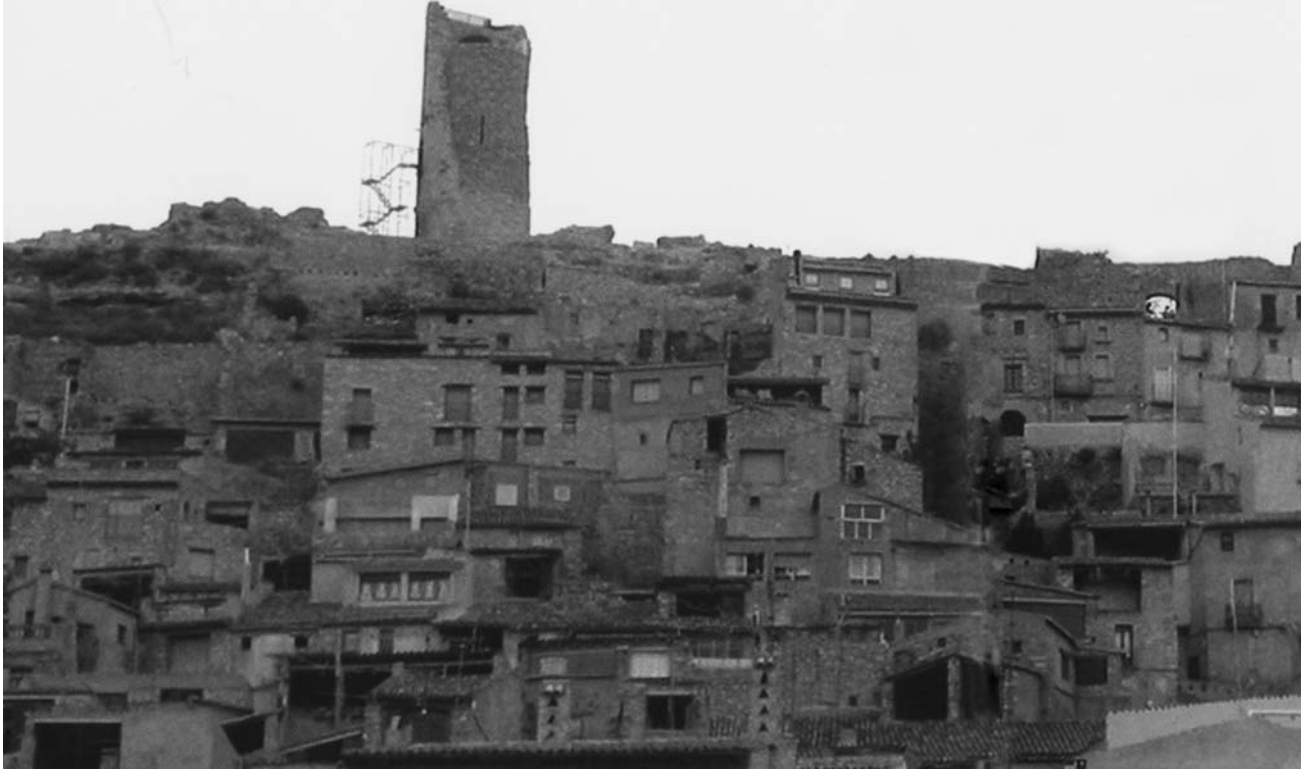
Fig. 1. La vila de Guimerà, en què sobresurten la torre i l'església gòtica de Santa Maria.

Si Tàrrega va ser el punt d'estada i del taller de pintura durant més de trenta anys, fou també el centre creatiu per pintar, entre altres, els retaules de Cervera, Santa Coloma de Queralt, Granyena i Vinaixa, on, a través dels seus contractes, queda registrada part de la seva bibliografia. Hem de pensar que la vida d'un pintor de retaules no era notícia i que els seus treballs formaven part dels encàrrecs per decorar les parets i els frontals d'altars de les esglésies, monestirs i capelles privades de castells i palaus. Amb tot, si bé normalment no signaven l'obra, deixaven ben escripturats tots els detalls, des del tipus de pintura, temàtica, materials, el muntatge, la quantitat i la forma de pagar, sovint amb florins d'or.