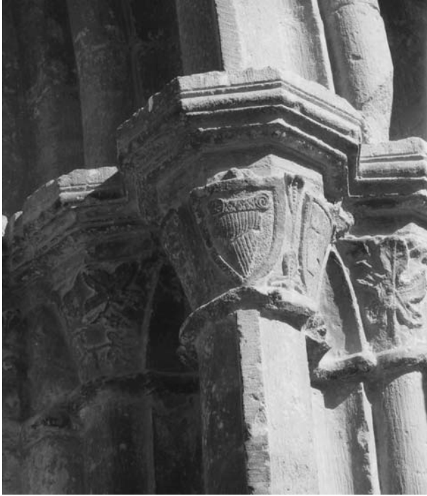
Fig. 4. Capitells del portal amb el escuts de les famílies Alemany i Rocabertí.

La història ha donat una part de raó, i es podrà escriure que arran del mecenatge influent en les primeres dècades del segle XV, es podria fixar l'atenció en la persona de Dalmau de Mur i Cervelló. Aquest personatge és considerat com un gran promotor de les arts, que del 1419 al 1430 fou arquebisbe de Tarragona. Amb aquest pensament hem de comentar que els Dalmau de Mur eren quatre germans i que un d'ells fou la referida Aldonça de Mur, senyora de Guimerà. El prelat Dalmau de Mur, nascut a Cervera el 1376, va ser bisbe de Girona (1418), arquebisbe de Tarragona (1419) i Saragossa (1430), i canceller de la Corona d'Aragó (1422-1439). Fou molt important en el món de la política i les arts, i coneixia molt bé l'entorn de Cervera i Tàrrrega, com també la vila de Guimerà. Per tot això podem intuir que era de la mateixa generació i del cercle proper a Ramon de Mur, i si partim que Duran i Sanpere, 24 historiador i fill de Cervera, ens