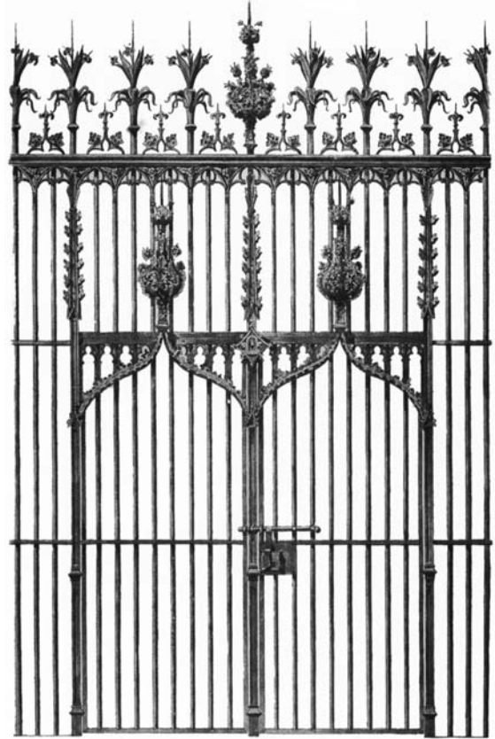
G. Vilalta, reixa que tancava la capella de Sant Benet. 1448.

Al darrer terç del segle XIV, la construcció de la seu gòtica coexistia amb l’enderroc de la seu romànica i, paral·lelament a la construcció de reixes noves, se’n feien malbé altres d’instal·lades. Així, el 2 de maig de 1377, l’obra pagà al beneficiat de l’altar dels Apòstols “per les reixes que féu adobar que l’obre li avia malmeses”. 45