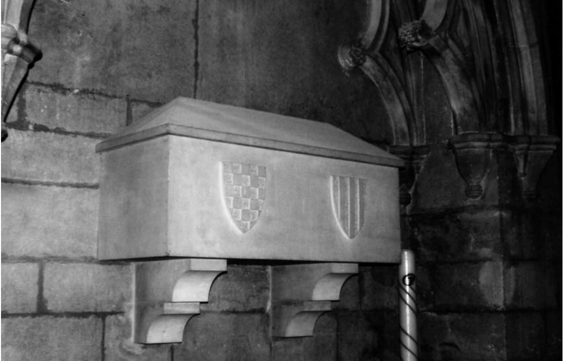
Urna amb les despulles dels comtes d'Urgell, a Bellpuig de les Avellanes.