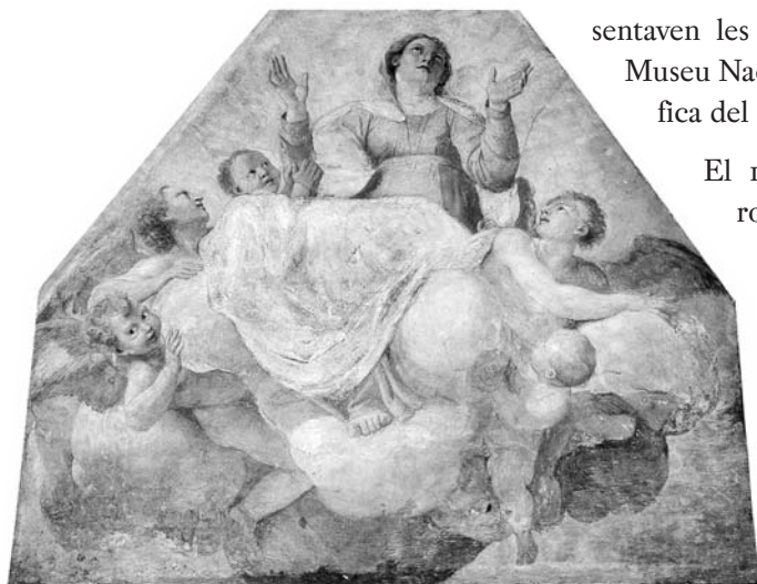
Fig. 2. Annibale Carracci, Assumpció de la Verge , 1604-1605. RACBASJ, inv. 890 (MNAC 5.674).