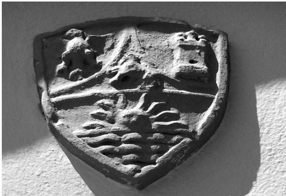
Escut d'armes dels Dalmasses-Gomar a la façana de la capella de Mare de Déu de la Cabeça, que segurament substitueix el que hi havia abans, del duc de Sessa.