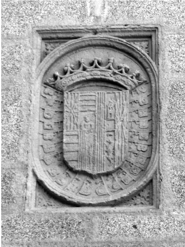
Escut del duc de Sessa, amb les armes dels Fernández de Córdoba sobre la llinda del portal del castell de Calonge, la que dóna a la plaça Major.

serioses dificultats econòmiques les universitats de dites viles, i els impedia “ administrar aquells los molts negocis y quefers que nos han oferts y se nos ofereixen cada dia per dita universitat ”. En altres paraules, no podien treure benefici dels arrendaments municipals, principal font d’ingressos dels comuns (les despeses que generava la guerra anaven en augment i l’administració necessitava noves fonts d’ingressos). Qualsevol infracció o cobrament no autoritzat estava amenaçat de càstig pel segrestador, que “ per raó d’aquella (pena) no pogués venir dany a nosaltres ni altres persones comuns ni universitats ”. 5