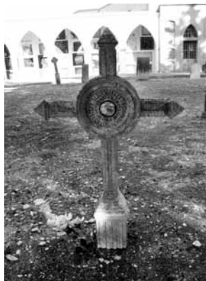
Creu, Oliveres, any 1928, inclou foto dins el cercle.