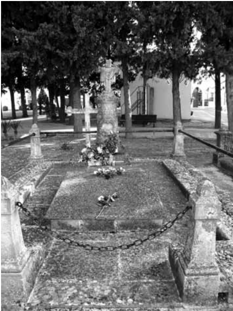
Mausoleu de la família Florensa.