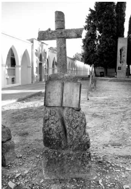
Creu (tipus 12), Bertran, any 1917

Concretant, de les esteles discoïdals de l'època antiga existents dels vells cementiris de Bellpuig, en podem catalogar de tres tipus: A, B, i C. De les esteles-làpides discoïdals existents al cementiri de Bellpuig, actualment són de tres variants o tipus de format, 6 són imitacions i altres 7 són un conjunt de variacions i d'estils de traspàs, si bé totes elles porten la simbologia de la creu dins el cercle i cap decoració repetida; altre tipus, 8, és una làpida de punta gòtica, i del tipus 9 al tipus 11 són grans pilarets amb creu o monòlits coronats per una gran creu d'una sola peça, un altre tipus, el 12 és una làpida gran molt curiosa, les mostraré fotogràficament (com se sol dir la imatge val més que mil paraules i escrits). Caldria estudiar i catalogar aquests petits monuments sepulcral com a peces patrimonials locals que no han de desaparèixer per cap motiu i deixar-les per sempre al seu lloc, al cementiri municipal.