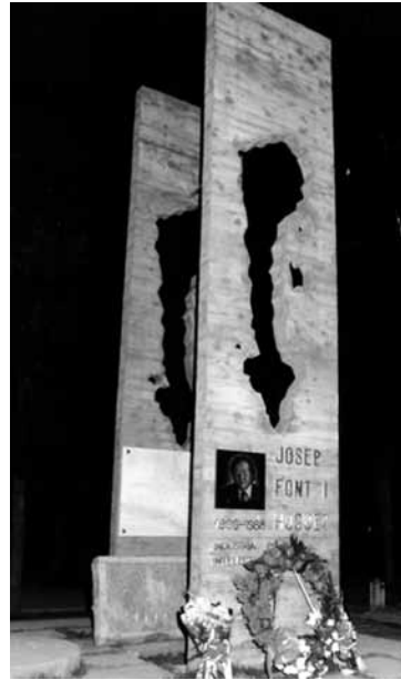
Mausoleu família Font-Huguet, any 1988.