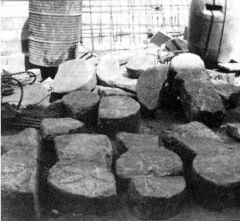
Esteles discoïdals trobades a la casa del senyor Francesc Grañó, a l'avinguda de Preixana.