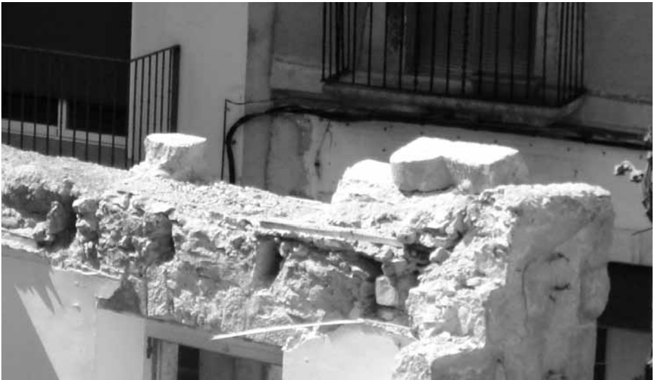
Estela discoïdal apareguda a l'enderroc de la casa Elies, carrer Homenatge a la Vella.