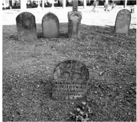
Làpida (tipus 7) Panadés any 1940. (Al fons làpides tipus 7, 8, 11)