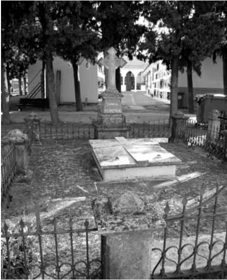
Mausoleu de la família Esquiús, any 1919.