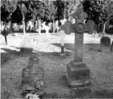
Sepultura discoïdal (tipus 1), any 1941 Puig, i creu sense dades.