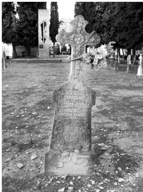
Creu (tipus 10), Farrerons, any 1918