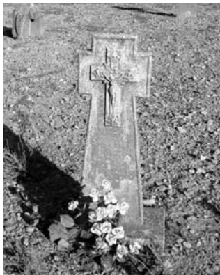
Creu de ciment, sense dades.