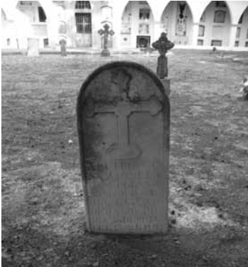
Làpida (tipus 7) Caselles, any 1923.