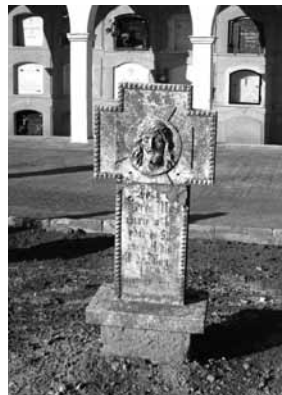
Creu de ciment, Serra, any 1959.