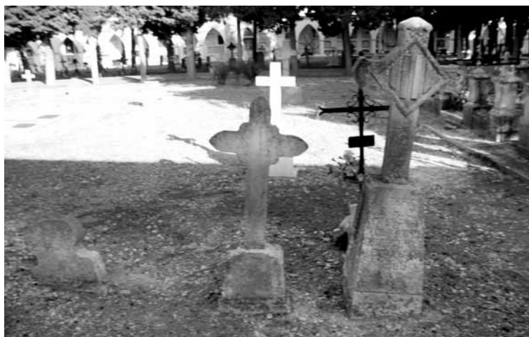
Làpida (tipus 2) sense dades. Creu (tipus 11) sense dades. Creu (tipus 11), Aubach, any 1918.