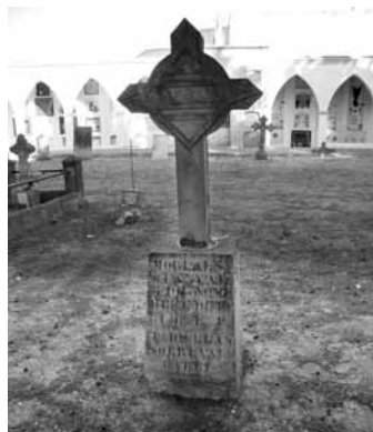
Creu (tipus 11) Sobrevals, any 1931.