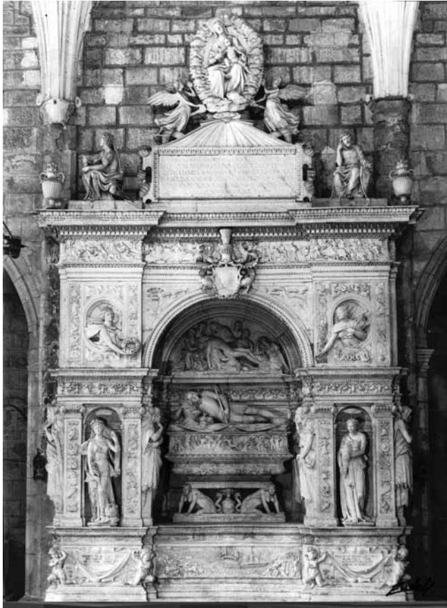
Mausoleu de Ramon de Cardona i Anglesola, parroquia de Sant Nicolau.

en forma de pilaret cimat amb un disc còsmic o rodó, simbologia de la vida solar; amb l'estela, el difunt deixarà constància de la seva existència i recordança pels seus familiars, tot representant el disc com el seu propi cap i cos del difunt que busca la perpetuïtat amb el pas dels temps, del més enllà amb l'esperança de salvar l'ànima eterna, amb senyals i inscripcions cristianes de record generalment amb el símbol de la creu. Malauradament aquest desig no ha estat possible d'acomplir-se per la modernitat del pensament i la inconsciència dels homes i dones d'avui, i de tot un país que s'oblida del respecte que devem als propis difunts que ens precediren i que són els parents i avantpassats propis.