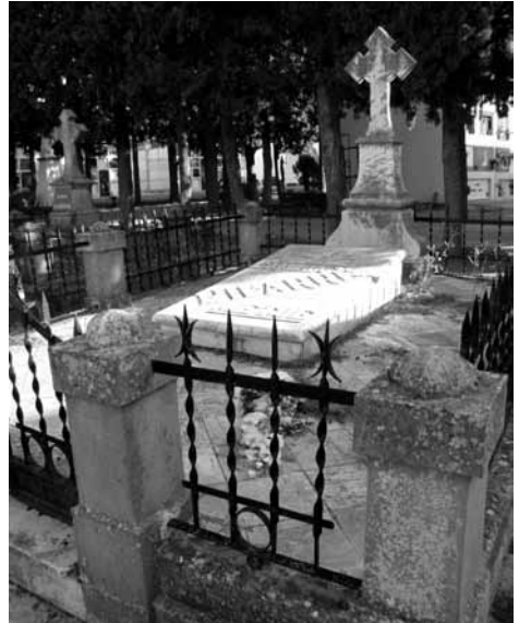
Mausoleu de la família Pifarré.