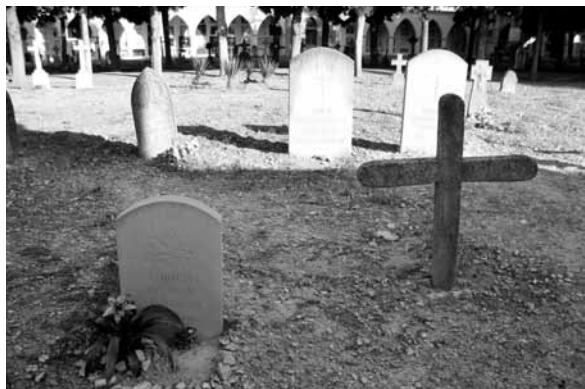
Al fons, làpida (tipus 8) Camins, any 1913, làpides (tipus 7) Berdegué, any 2008. Davant, làpida (tipus 7) Aubach, any 1941, i creu Santiveri.