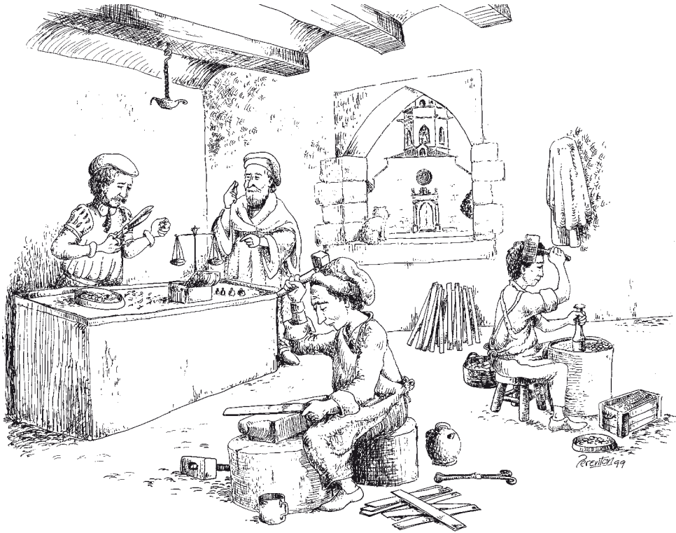
Taller de fabricació de moneda i ornaments.

I com deuria ser i passar, els artesans ara coneguts per moriscos i jueus continuaren obrant objectes de tots tipus o mesclant estils cristianitzats, símbols, senyals, etc.