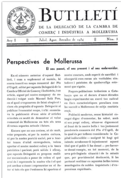
Portada d'un exemplar del butlletí de la cambra de comerç i indústria de Mollerussa.