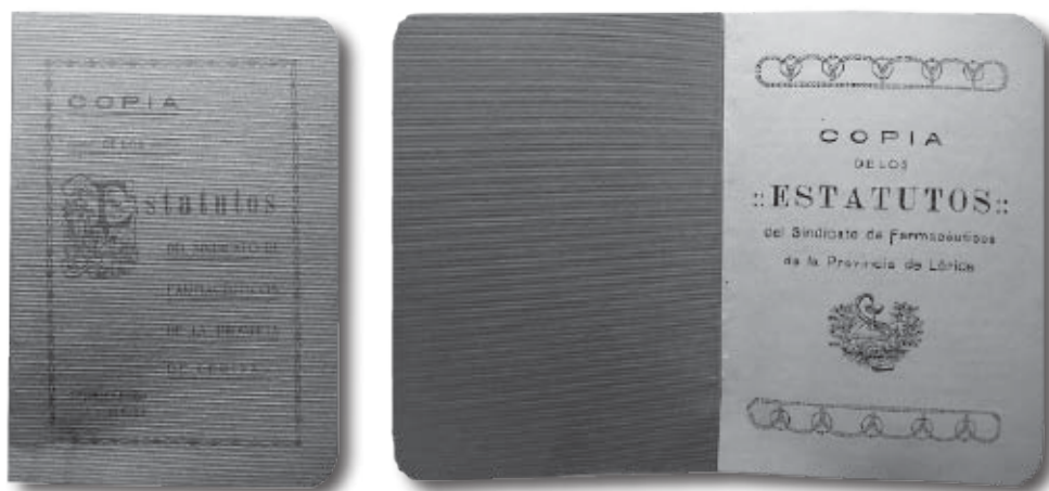
Fig. 1 i 2.- Còpia dels Estatuts del Sindicat de Farmacèutics de la Província de Lleida. Font: arxiu familiar dels hereus del farmacèutic Enric Solé, de Tremp. (Fotografia realitzada per l'autor)

Aquest projecte d'estatuts publicat al Butlletí número 25 té la mateixa redacció que una còpia que s'ha localitzat a l'arxiu familiar dels hereus d'Enric Solé, de Tremp.