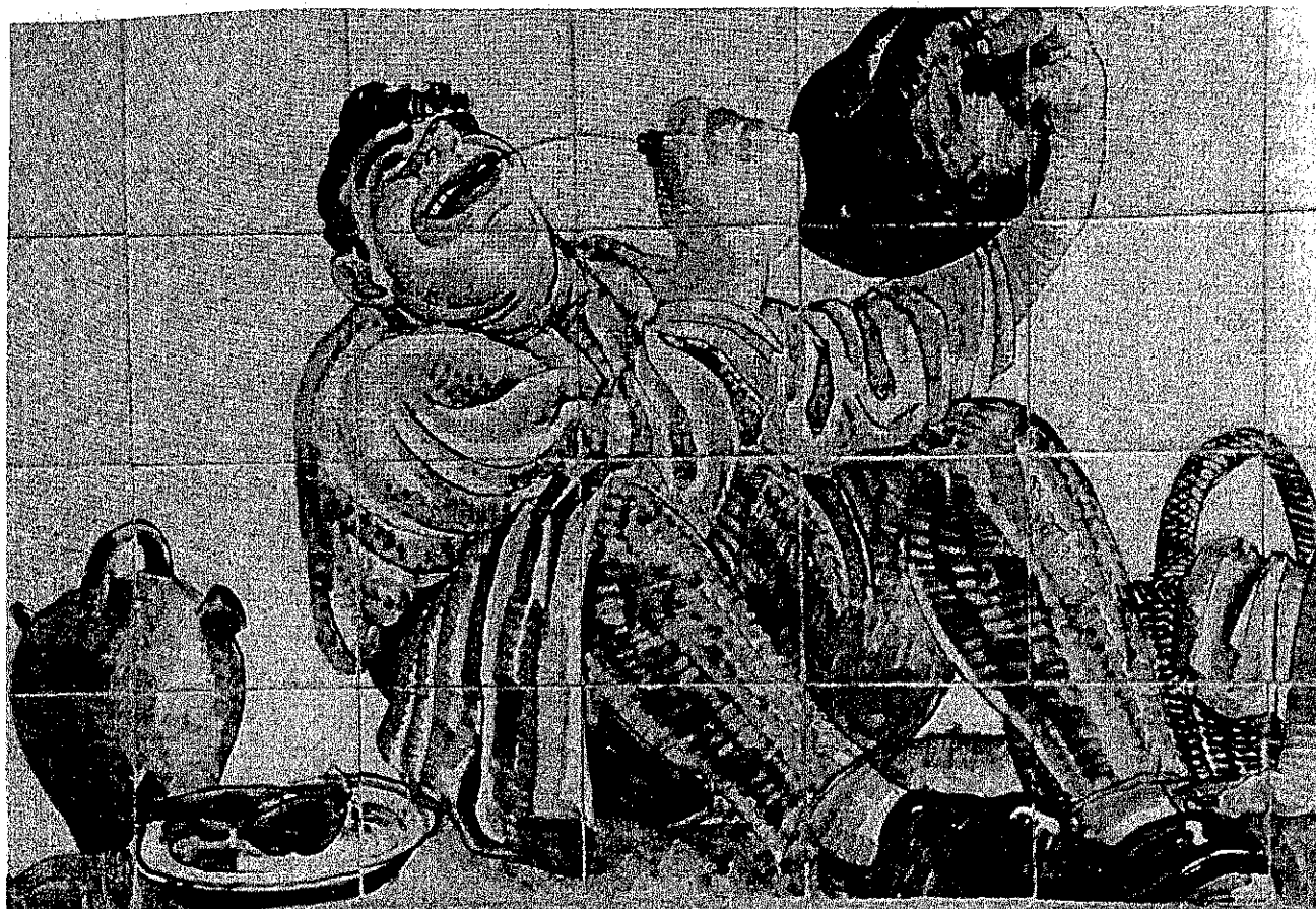
Pagès bevent vi. (detall del fris de Xavier Nogués) Celler Cooperatiu del Pinell de Brai (1919-1922)

vuitanta obres d'aquest gènere. Els temes més representats són les sardanes, les fires, les 'romeries', els paisatges, etc. Algunes d'aquestes obres les podem observar al Museu d'Art Modern de Barcelona (MAMB).