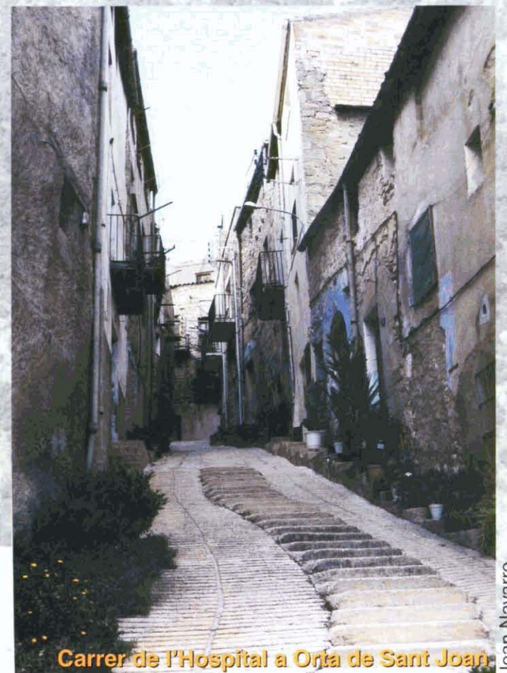
Carrer de l'Hospital a Orta de Sant Joan