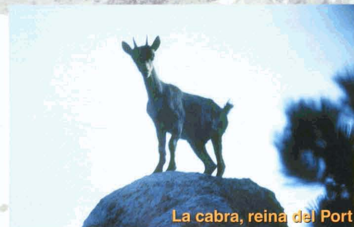
La cabra, reina del Port