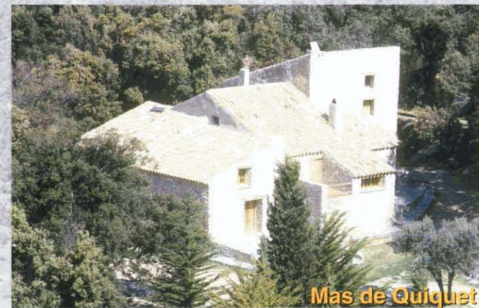
Mas de Quiquet