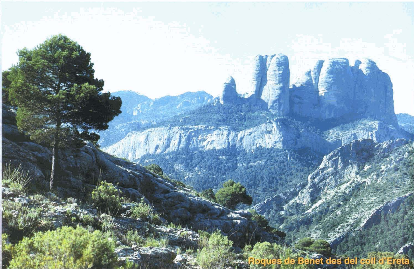
Roques de Benet des del coll d'Ereta