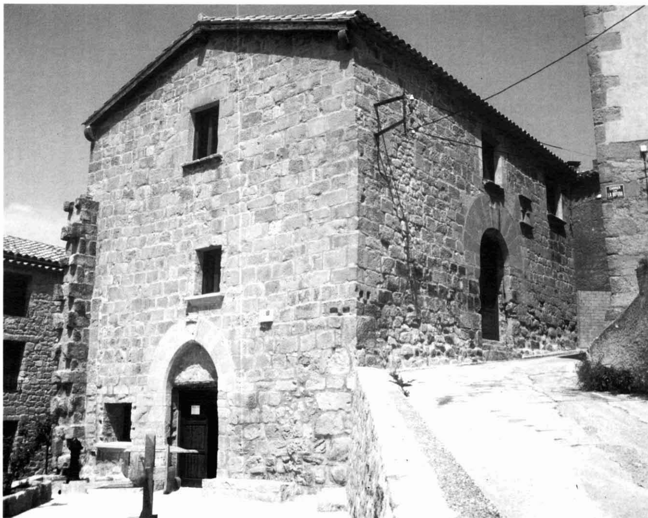
Centre Picasso d'Orta de Sant Joan.

L'ajuntament d'aquells anys ens va deixar el local de les antigues escoles. Estava en unes condicions lamentables; però el vam endreçar i pintar; un lloc senzill, auster i molt adient per l'exposició, amb vistes a la muntanya de Sta. Bàrbara. El 30 de novembre de 1981 havia de ser la inauguració. Però l'Ajuntament la va aturar, ja que aquest local s'havia de dedicar a caserna de la Guàrdia Civil, que en aquells moments estava precisament on avui és el Centre Picasso, en unes condicions molt dolentes. A canvi, se'ns va prometre que, si algun dia