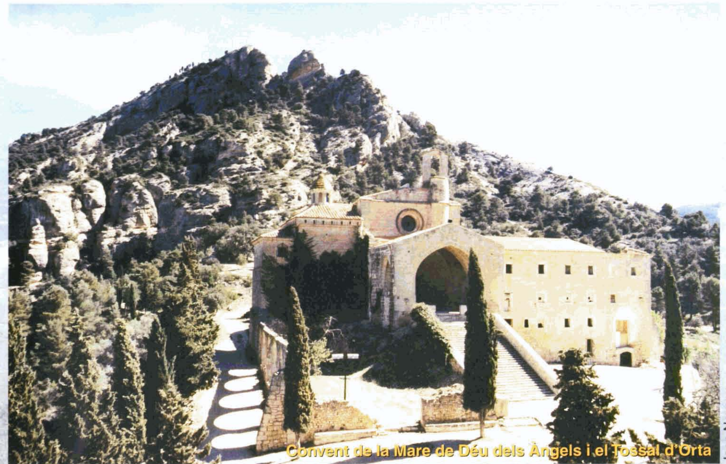
Convent de la Mare de Déu dels Àngels i el Fossal d'Orta