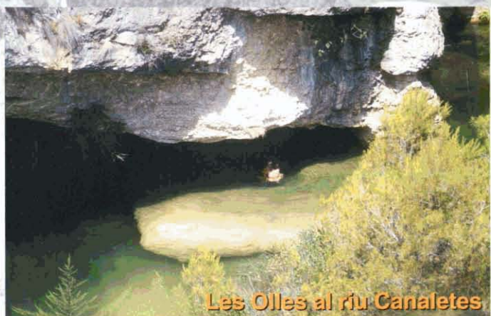
Les Olles al riu Canaletes