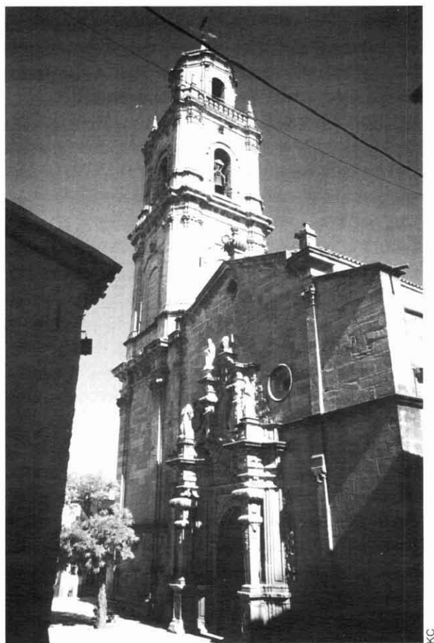
Església parroquial de Sant Llorenç.

Les dades que a continuació explicaré, to-