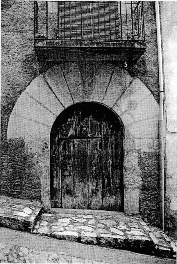
Portalada de pedra (1588) a la Fatarella.

posició dins de la societat medieval, afirmen cada vegada més aquesta vessant de vida social que hem apuntat. És un aspecte de tots conegut i que encara avui hi ha qui gosa posar-ho per escrit, com fa en Quico el Cèlio i la seva colla en el seu darrer disc quan canta: «Embutxer i batxillera i portadora de noves, si no et movies de casa no sabries tantes coses.»