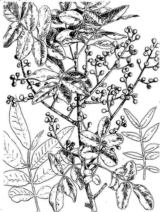
Pistacia Terebinthus L.

Però hi ha una planta que és un veritable mostrari de noms diversos, ens referim a la Pistacia terebinthus L. D'aquest arbret tenim recollits els noms de: Herba mosquitera (51) pels pulgons alats que parasiten les seves fulles, Garrofer bord (154) per les bajoques una mica semblants a les garrofes que li forma aquest pulgó abans esmentat, Mata borda (172), per la seva semblança amb la Mata ( Pistacia lentiscus L.), i encara Rataboc (93) Matasalva (69) i Púdoi (186) de més difícil escatir.