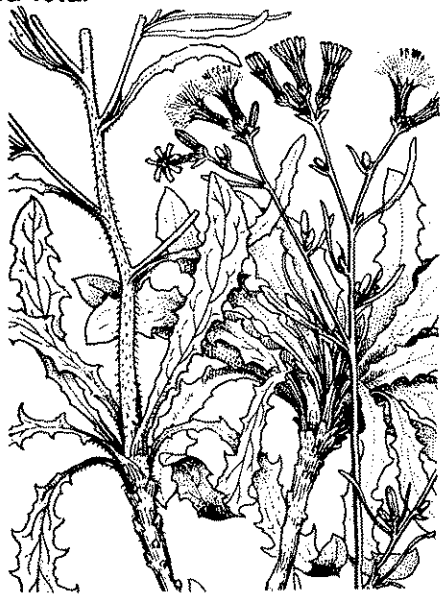
Llonja Chondrilla juncea L.

Arribats al Mas de Vinya feien bullir aquesta goma almenys mig dia per netejar-la de la terra i codolets enganxats que du i, tot seguit, ja freda, la posaven ben neta damunt d'una pedra de calà ample on la picaven amb un mall fins a lligar-la tota.