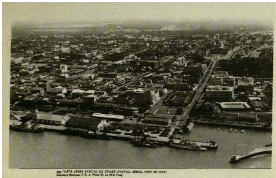
Fig. 14. Postal dos anos 50. À direita vê-se nitidamente a Avenida Aguiar e as praças Mouzinho de Albuquerque e 7 de Março.

A importância investida na Praça Mouzinho, a única praça que recebe a qualificação de “monumental”, é confirmada pela construção dos novos Paços do Concelho, prevista nela desde finais dos anos 20. 127 Em 1931 decide-se levantar também aí a nova Catedral. 128 Só a partir de 1935 os vários projectos vão ser implementados, devido, porventura, à crise e à reestruturação administrativa das possessões ultramarinas destes anos. 129 O Governo colonial completa o fundo para o monumento, enquanto a Câmara Municipal autoriza as obras da Catedral, concretizadas, com largo apoio estatal, em 1936-1944. O concurso camarário para os Paços do Concelho, em 1937-1939, é ganho pelo projecto de Carlos Santos, arquitecto português que vivera desde 1917 em São Paulo. O edifício é construído em 1940-1947.