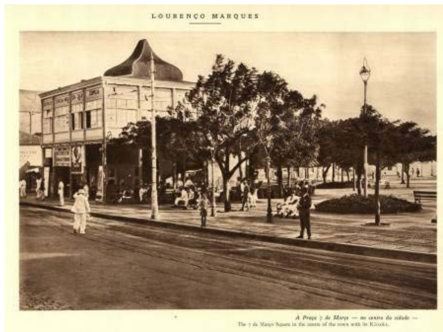
Fig. 2.

Só a partir do início do século começam a ser erguidos construções de maior resistência. É, por isso, uma cidade recente, “sem memória”. O passado de Lourenço Marques consumiu-se ele próprio, sem deixar vestígios , escreveu um historiador em 1960. 25 Nem é, de resto, uma cidade “monumental”, como convinha à capital e à sua crescente visibilidade internacional. São frequentes, ao longo da primeira metade do século XX, queixas acerca de monotonia , da ausência de um cinho monumental , a falta de praças públicas com monumentos, centros secundários de aglutinação de povoamento flutuante . 26