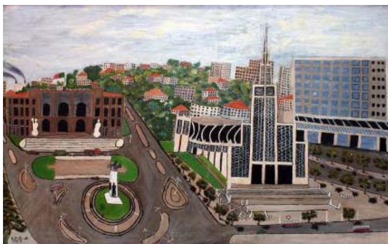
Fig. 17. Sem título, ass. B.J. Sande, 1963.