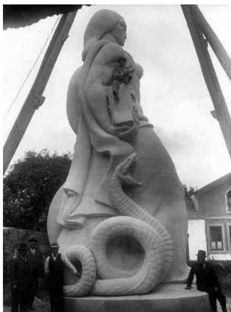
Fig. 5. A figura da Pátria.

Sobre esta base feita de pedra e corpos, suporte intencionalmente menorizado, emerge a figura da Pátria, ativa e dominante (...) majestosa e augusta , recebendo sem artifícios de pequenos detalhes, a gigantesca ideia de perpetuar pela pedra os feitos e sacrifícios . A pátria, conceito político ( a parte fluida e espiritual da ideia congemina da, escrevem os autores) a que a escultura dá forma, é aquilo que domina e que permite aos autores resolver a dupla dimensão de comemoração e celebração.