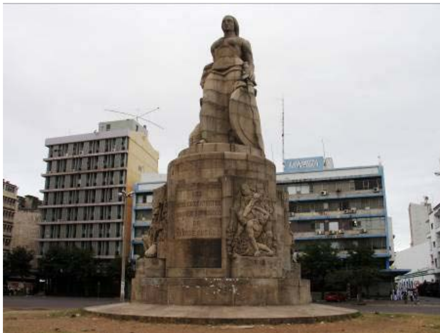
Fig. 4. O Padrão de Guerra actualmente.