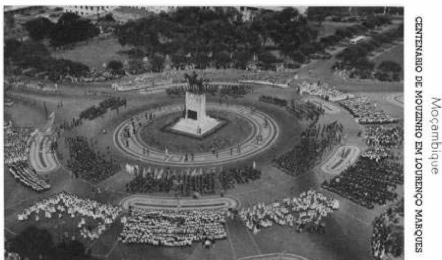
Fig. 16.

Esta questão, do “moderno” e da “tradição” não pode por isso só ser debatida ao nível da sua expressão em estilos arquitectónicos. Neste aspecto, a Praça Mouzinho parece conter na sua própria organização espacial esta dupla presença da cidade moderna e do espaço de culto. 139 Por um lado, tinha, e tem, uma função importante para a organização dos fluxos de trânsito. Mas esta funcionalidade traduz-se num intrincado desenho de entradas, saídas e ilhas ajardinadas. Há aqui, a meu ver, uma lógica cénica, sobreposta à organização funcional: através do desenho a praça é dividida em parcelas, indicadas pelas linhas no calçado dos passeios, cada uma com o nome de um dos locais de batalha mais importantes das campanhas de Mouzinho inscrito à volta do monumento.