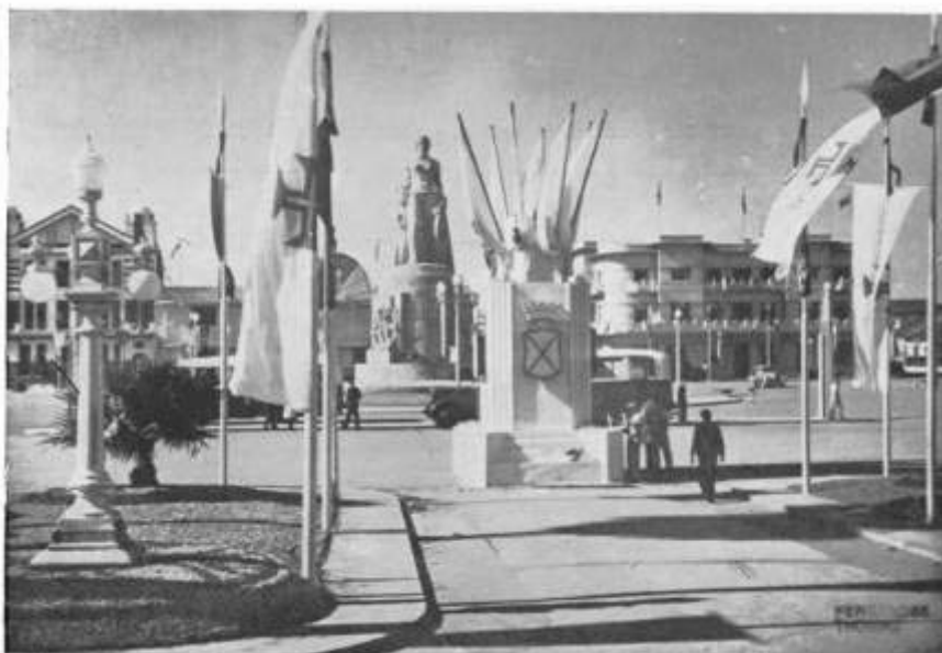
A Praça Mac-Mahon

Fig. 7. A Praça Mac-Mahon durante a visita presidencial de 1939.