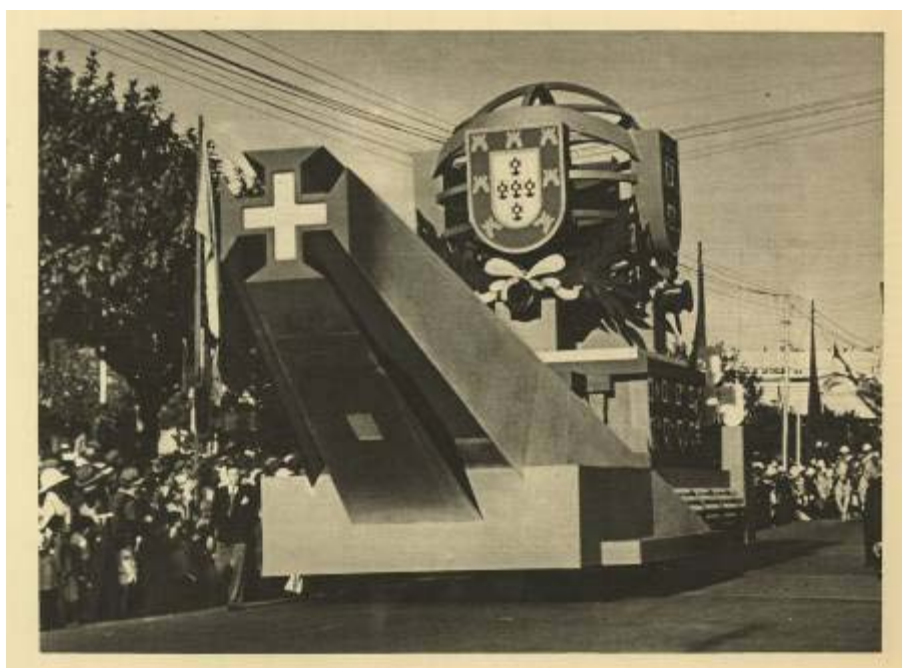
Fig. 8. Carro alegórico do Império. Repara-se que a Cruz de Cristo representado no dianteiro do carro cita o projecto vencedor, nunca executado, do primeiro concurso de Sagres (1934), dos irmãos Rebelo de Andrade e Ruy Gameiro.

Fig. 7. A Praça Mac-Mahon durante a visita presidencial de 1939.