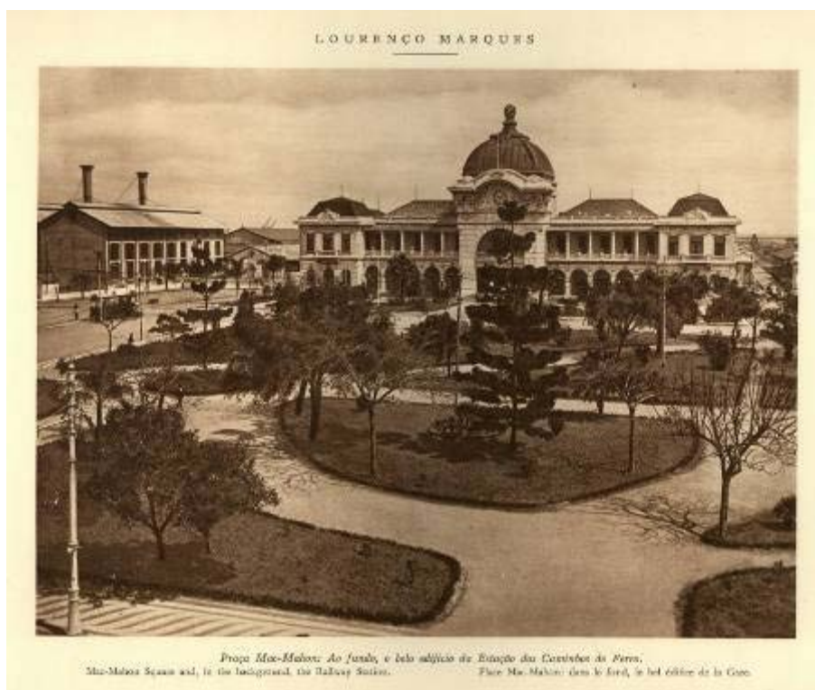
Fig. 3.

Decide-se situá-lo na Praça Mac-Mahon (actual Praça dos Trabalhadores), espaçosa e central, mas também a única praça que oferecia um enquadramento suficiente monumental, pela presença da Estação do Caminho-de-ferro (1910), representativa, por sua vez, do estatuto e grandeza que se previa e desejava para a cidade.