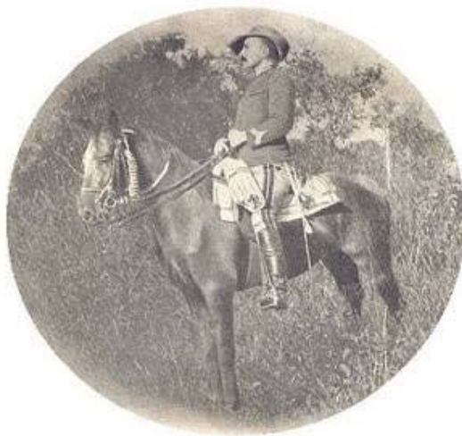
Fig. 9. Mouzinho de Albuquerque antes da partida para os Namarrais, 1897.

Havia, contudo, uma referência óbvia: uma conhecida fotografia de 1897, que retrata o oficial a cavalo em Moçambique, antes de partir para a campanha dos Namarrais. 96 Esta imagem marcou o imaginário colectivo. É a que Marcelo Caetano tem em mente quando diz, num discurso de 1940, o seguinte: Sempre que em minha imaginação evoco a figura de Mousinho, é a cavalo que o vejo, direito na sela, a face tisonada sob a larga aba do chapéu de feltro e os olhos profundos, iluminados pela visão do combate que se aproxima. 97