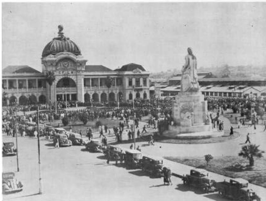
Aspecto da Praça Mac-Nahas no momento em que S. Ex. a o Governador Geral penava em retirar a guarda de honra.