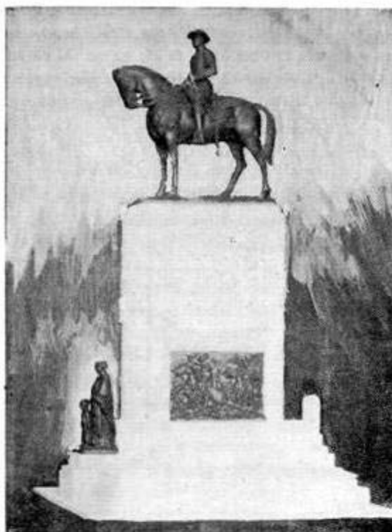
Maqueta do monumento, da autoria do escultor Simões de Almeida e do arquitecto António do Couto

Fig. 10.