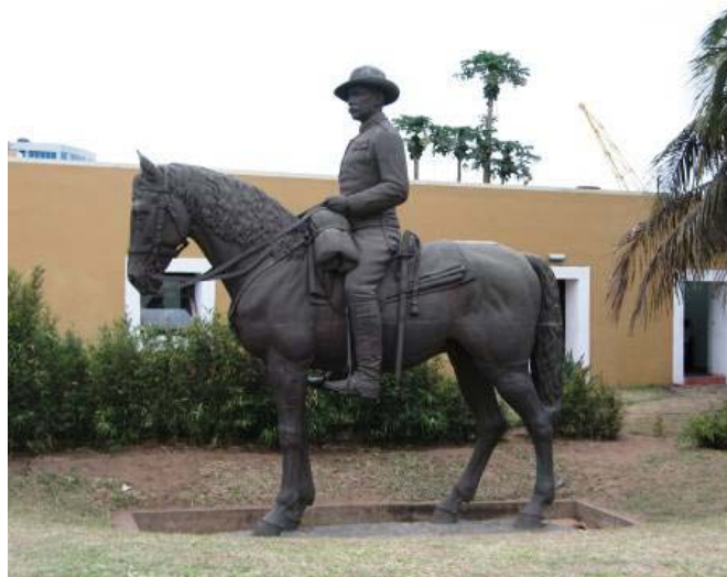
Fig. 11. A estátua de Mouzinho de Albuquerque na sua localização actual.

Simões de Almeida (sobrinho) utilizou [na estátua] os ingredientes essenciais das suas convicções naturalistas, glosando compositivamente o efeito do pormenor. O resultado é uma sequência narrativa extremamente elaborada, abarcando toda a anatomia do cavalo e seus adereços, bem como o próprio Mouzinho, longe ainda do seu tráfico fim e que aqui é representado numa pose nobre mas apaziguada, trajando com rigor militar e com um grande verismo facial. Trava-se claramente de mostrar o lado mais civilizacional que belicista da saga colonizadora dos Portugueses e sendo essa a intenção pode dizer-se que o escultor a interpretou com grande rigor. 101