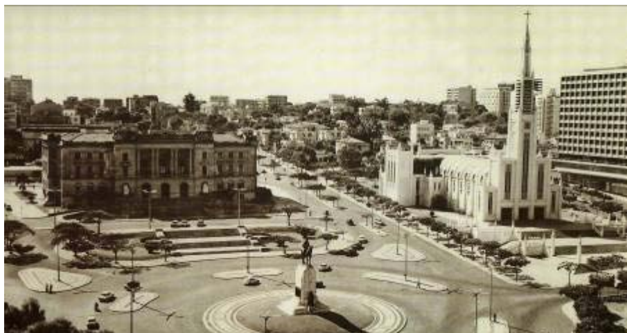
Fig. 15. Postal dos anos 50/60. A Praça Mouzinho de Albuquerque.

O edifício municipal eleva-se acima de uma escadaria monumental frente ao Monumento a Mouzinho. Assim é visível desde a Praça 7 de Março, servindo simultaneamente de fundo cenográfico e de plateia para os representantes do poder. É, portanto, uma estrutura cénica, coroada pela praça, local de representação e palco de cerimónias.