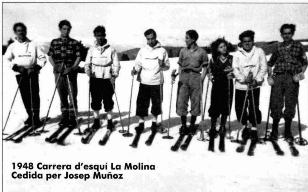
1948 Carrera d'esquí La Molina

L'entitat es va inscriure a la Federació d'Entitats Excursionistes de Catalunya. L'any 1933 va ser l'encarregada de coorganitzar, juntament amb el Centre Excursionista de Terrassa i el Càmping Club de Catalunya, el Campament General de Catalunya al Pla de la Garsa. En aquest aplec hi van participar uns cinc-cents campistes, i es va haver de fer front a la pluja i el vent. Malgrat tot, els membres de la junta directiva el qualificaren d'èxits. A nivell local, l'AEM va participar en el Primer Campament Andreuenc, celebrat al bosc de can Jové, al terme municipal de Montcada, els dies 17 i 18 de setembre de 1932. Aprofitant la celebració del campament andreuenc s'organitzà el II Aplec Excursionista de Sant Andreu. En anys successius, i fins a l'esclat de la Guerra Civil, es van anar organitzant campaments i aplecs excursionistes, sovint juntament amb altres entitats excursionistes de Sant Andreu. En el butlletí del mes de setembre de l'any 1933 se'n fa publicitat amb l'escrit següent: «Amb èxit creixent hem celebrat aquest any el nostre III aplec