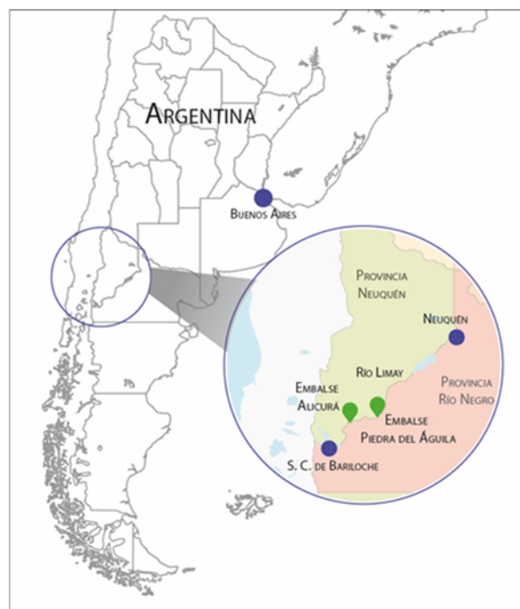
Figura 1. Ubicación geográfica de la producción piscícola en Patagonia Norte. Elaboración propia.

En Argentina, la producción acuícola se inició de forma extensiva en la década del '80. En Patagonia Norte, específicamente, la actividad piscícola se vincula a la construcción de represas hidroeléctricas sobre el Río Limay (Figura 1), ya que representan el único sitio autorizado para el engorde de truchas arco iris ( Oncorhynchus mykiss ). Desde mediados de los '90, con la incorporación de tecnología que condujo a prácticas de carácter intensivo, se evidenció un gran crecimiento de la producción. Por esos años, las explotaciones piscícolas ubicadas en los embalses del Río Limay representaban casi el total de la producción acuícola nacional, que rondaba las 1.000 ton/año (Luchini y Panné-Huidobro, 2008; Wicki y Luchini, 2002). Durante los años 2000, se produjo una diversificación de las especies cultivadas en el país, lo cual se tradujo en un fuerte crecimiento del pacú, que superó así a la participación de la trucha en la producción argentina. En 2014, la producción acuícola nacional alcanzó su máximo de 4.000 toneladas/año. El pacú representó más de la mitad de dicho agregado, mientras que la trucha, con sus 1.400 ton/año, sólo dio cuenta de un 36% (Panné-Huidobro, 2014, 2015, 2016).