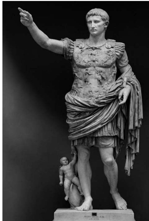
Estàtua de l'emperador Octavi August

El primer local de l'Associació Catalana d'Excursions, entitat precursora del Centre Excursionista de Catalunya, va ser al carrer de l'Argenteria. A mitjans de 1877 el Centre es va traslladar al segon pis de l'edifici que encara ocupa actualment en el carrer del Paradís núm. 10, en el lloc que es considera el de