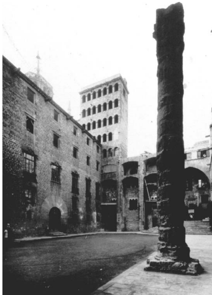
La quarta columna va estar situada, durant anys, a la Plaça del Rei