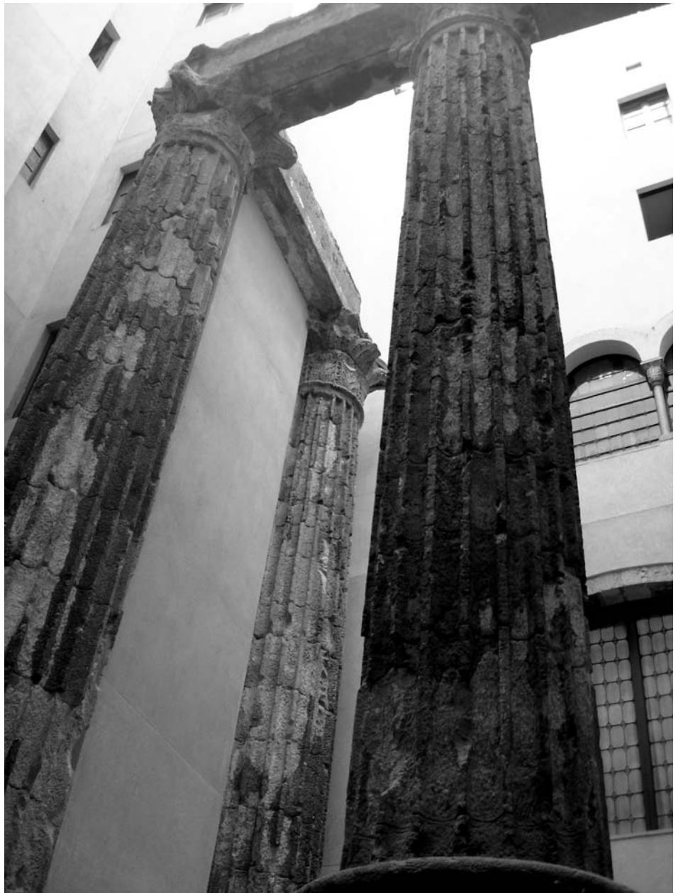
Les columnes del temple romà d'Agust, avui, al pati del Centre Excursionista de Catalunya

Fins aquí el relat de la part que fa referència a les