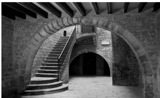
Pati d'entrada al local del Centre Excursionista de Catalunya

Sempre he recordat amb una certa emoció -fa una colla d'anys, era un dia rúfol i gris d'hivern que anava caminant pels carrers estrets de l'entorn de la catedral de Barcelona-, la impressió que em va causar al girar una cantonada i trobar-me de cop i volta davant la mola de quatre columnes de pedra, enormes, impressionants, que jo en aquells moments desconeixia i que en la meua ignorància vaig atribuir a algun monument antic. Després, amb el temps, vaig anar coneixent que es tractava del poc que en quedava del temple que la colònia romana de Barcino havia dedicat,