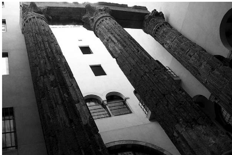
Les tres columnes que es volien traslladar al Castell de Santa Florentina de Canet

"El notable arquitecte Lluís Domènech i Montaner, soci del Centre i parent de l'esmentat propietari, d'acord amb el desig manifestat pel Consell Directiu del Centre, féu actives gestions per fer entendre al propietari que era millor desistir d'aquell propòsit. També gràcies a l'interès que sentia envers el Centre en Ricard de Capmany, gendre de Montaner, fou aturat l'intent i Barcelona conservà l'antic monument en l'indret on