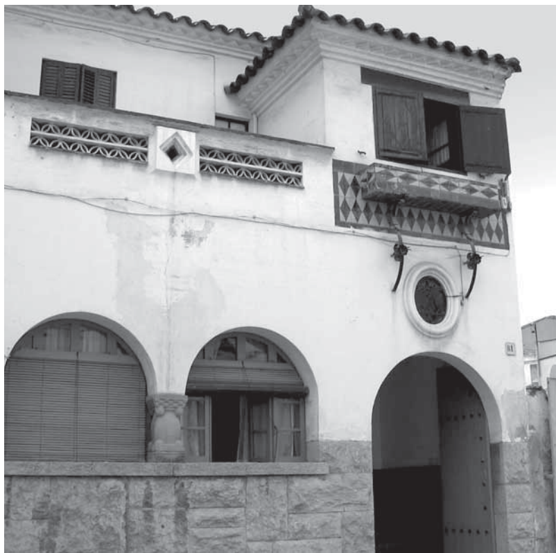
Casa Renau, de Rafel Masó

La fitxa del Museu Marítim, confirmant la gravetat de l'accident però sense parlar de víctimes, diu: "En el moment de l'avarada a la platja de Canet, la fragata va sofrir una avaria a l'obra viva i portada a Barcelona per a reparar, va decidir-se procedir a la reparació del buc. Un cop examinada pels bussos, veient que l'averia era pitjor del previst, es va decidir portar-la a la drassana de Toulon, on disposaven de dics més preparats que els de Barcelona per fer reparacions importants."