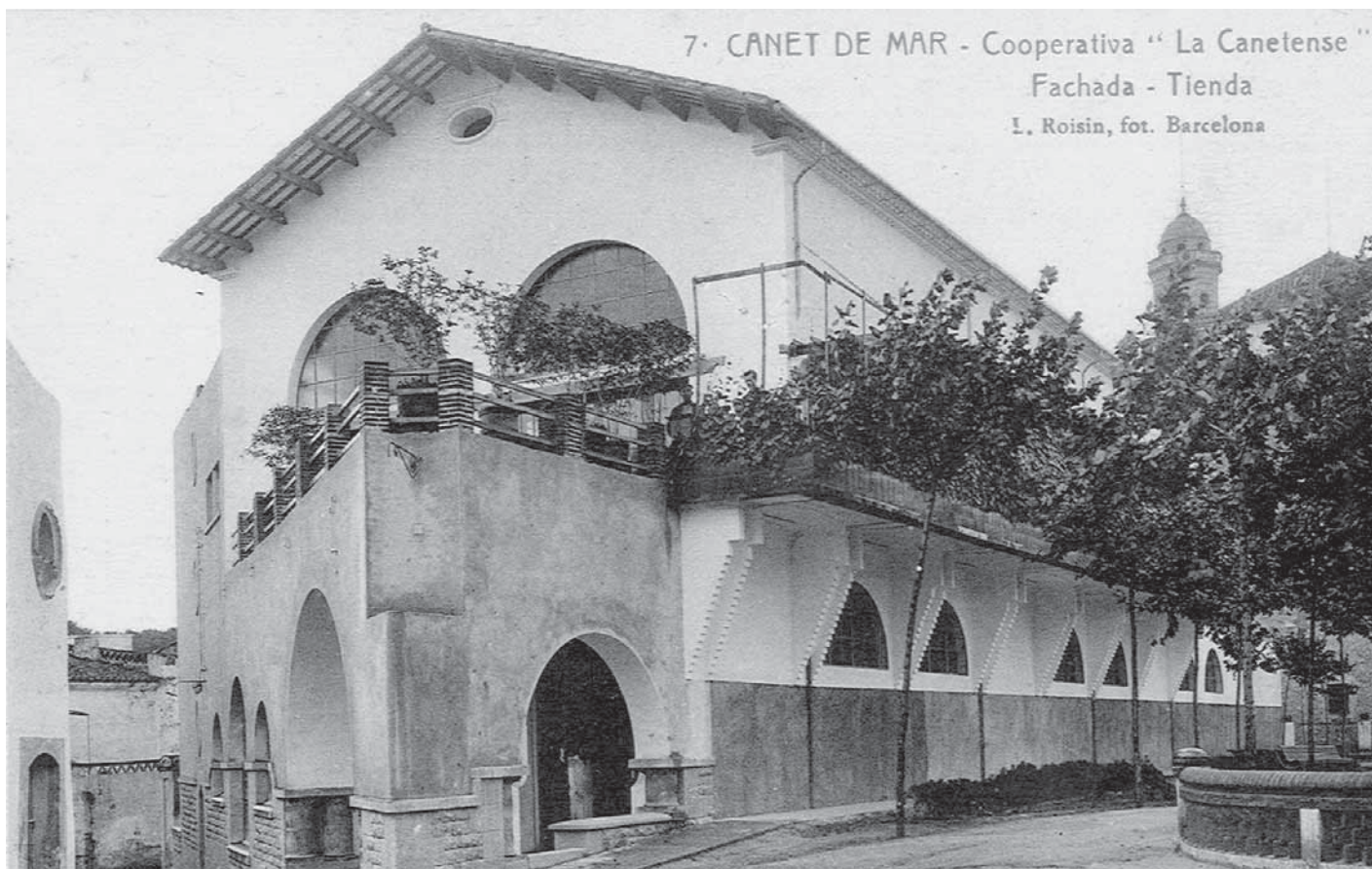
L'edifici de la cooperativa poc després de la inauguració el 1925. Obres de l'arquitecte Masó

altres llocs, entre ells a Canet, que és el cas que ara ens ocupa.