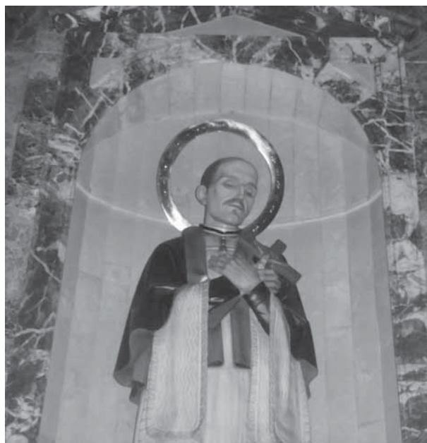
Fotografia actual de la imatge de Sant Josep Oriol

D'aquesta devoció popular al sant se n'expliquen forces anècdotes, en vull recollir una de sensacional, que diu que: Un dia a la capella de sant Josep Oriol de l'església del Pi, sens dubte la capella "oficial" i més concorreguda per demanar favors al sant, és van trobar agenollats, a primera fila, dos homes desesperats; els dos clamaven per aconseguir els favors del sant; un d'ells era un ric potentat que volia que el sant l'ajudés a redreçar els seus negocis, i al costat un pobre home que demanava no ser desnonat de casa seva al no poder pagar el lloguer; com que els dos peticionaris s'interferien constantment en les seves peticions al sant, el potentat posant mà a la cartera va treure un grapat de diners i posant-los a la mà del més pobre, va dir-li: "Au té aquests diners i marxa ràpid d'aquí que me'l distreus" -referint-se al sant-; ves per on s'havia produït el miracle pel més necessitat.