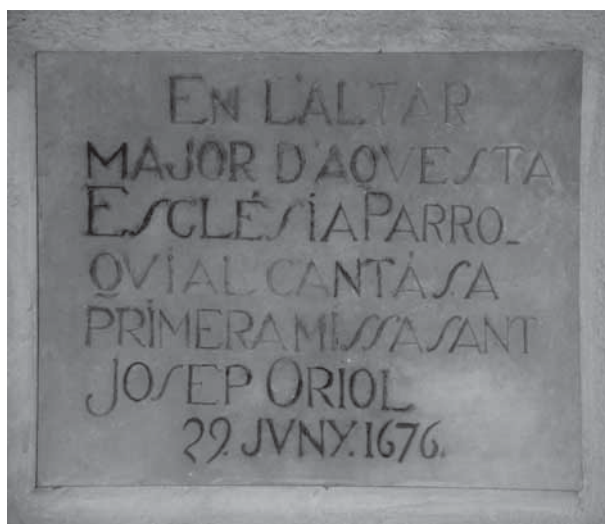
Placa commemorativa que recorda la primera missa cantada de Sant Josep Oriol a la parròquia de Sant Pere de Canet