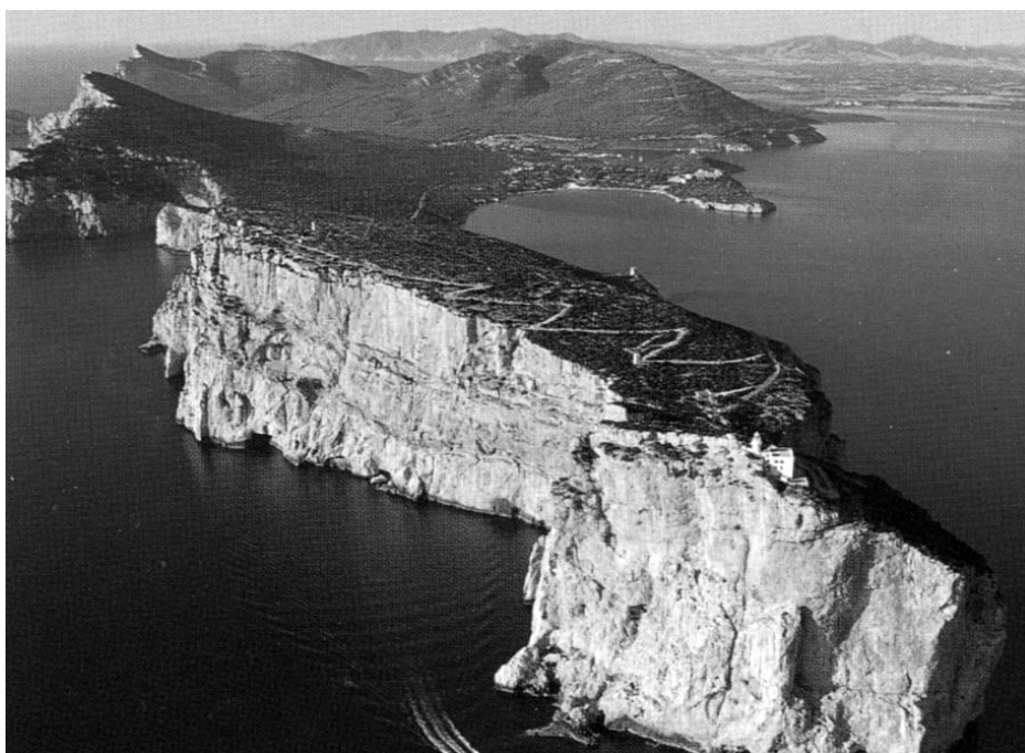
L'Alguer. El cap de la Caça a l'entrada del port del Comte

i trobar que pots parlar amb la gent amb la nostra mateixa llengua, tenint present que algunes paraules han evolucionat diversament a l'Alguer o al Principat. Molt de compte si trobant-nos a l'Alguer utilitzem la paraula "maco", "maca", perquè els causaríem l'efecte contrari del que pretendríem, ja que "maco" es refereix a una persona que ha perdut l'enteniment. Evitem problemes i fem servir una paraula més escaient com bonic, bonica. Quant al català de l'Alguer o alguerès, no podem menys que dedicar un record a la insigne personalitat de l'escriptor, diplomàtic i polític reusenc Eduard Toda, que va ser qui el 1888 va donar a conèixer i divulgar l'existència d'aquesta llengua, que havia quedat arraconada i al marge de la comunitat científica internacional.