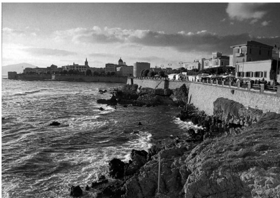
Muralla i baluards defensius del centre històric de l'Alguer