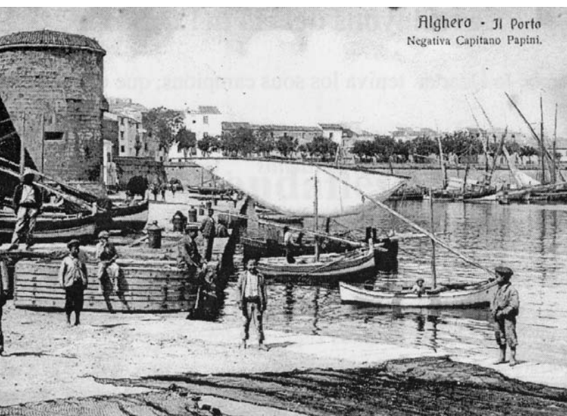
Muralla i baluards del port de l'Alguer