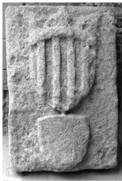
Escut de Catalunya a la muralla de l'Alguer

La ciutat de l'Alguer va néixer de la necessitat de colonitzar amb població fidel a Catalunya aquest enclavament estratègic de la costa sarda, tenint en compte l'escàs poblament de l'illa que deixava amplis espais costaners deshabitats; així va ser que el 1372, en temps de Pere III el Cerimoniós, es va poblar aquest punt estratègic amb catalans. No