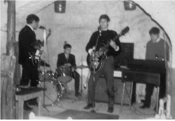
Un directe a El celler de Los Yunques