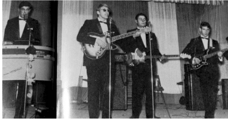
Foto d'una actuació de la Trinca Pop