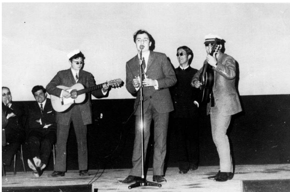
Alguns membres de la Tuturrull amb amics fent barrila en una Festa dels Vells a l'Odeón, (Icra, Planet, Dulsat i Galera)

Una colla d'amics va començar a gestar el conjunt vers l'any 1967, amb un primer nom: Els Joquis, de curta vida; de seguida van rebatejar-se amb el nom de The Tuturrull Club Band, en ser aquest un nom més sonor i una barreja de Beatles amb la paraula