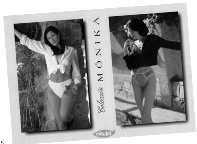
Catàleg Mituka que fabricava Pievesto

Com totes les idees brillants, la projecció internacional va venir sola, i grans indústries internacionals del món de la moda van arribar a acords amb Pievesto, amb el pagament dels corresponents royaltis per poder fabricar i vendre