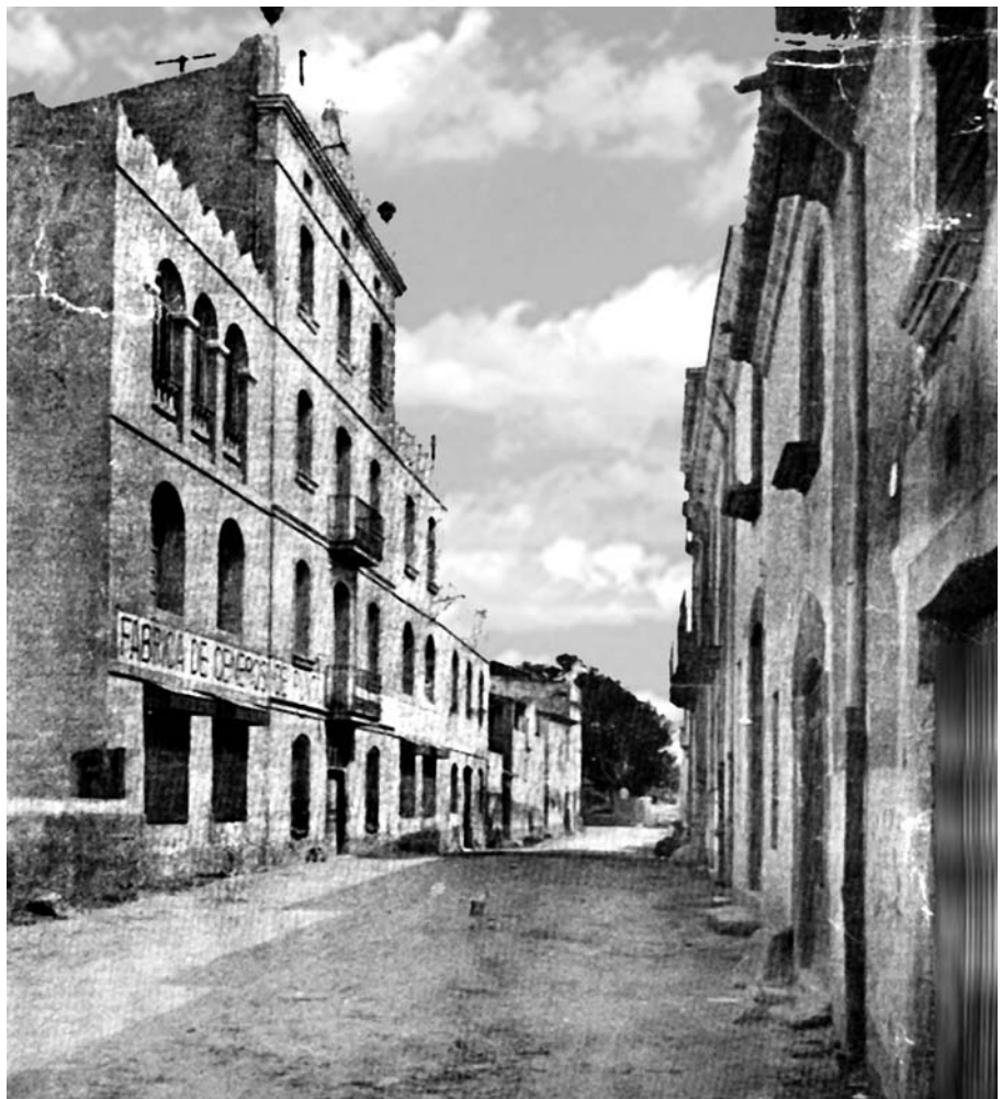
Fàbrica Jaume Romagosa, Staten Cta que havia estat la primera fàbrica canetenca moguda amb força de vapor el 1870. (CEC)

L'Escola va realitzar una gran labor pedagògica i d'ella en sortirien grans idees, algunes de les quals proporcionarien la formació tècnica a moltes generacions d'alumnes, tant de Canet com d'altres