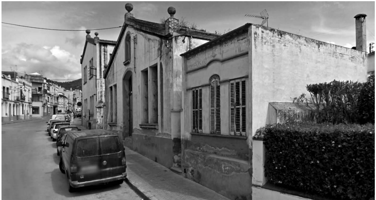
A la part superior, edifici de la fàbrica Pievesto SA a la riera del Pinar, 32

tècnicament se'n diu «vanissage», que s'aconsegueix gràcies al moviment automatitzat d'agulles i platines que formen les vagues del punt, és a dir, el ris, quedant la fibra sintètica teixida al costat exterior de la peça, mentre el cotó, fibra noble que protegeix la pell, queda teixida al costat interior; i així la usuària queda protegida de coïssors i irritacions no desitjades. La nova braga va ser registrada amb la marca «Mituka», nom amb el que va ser popularment coneguda.